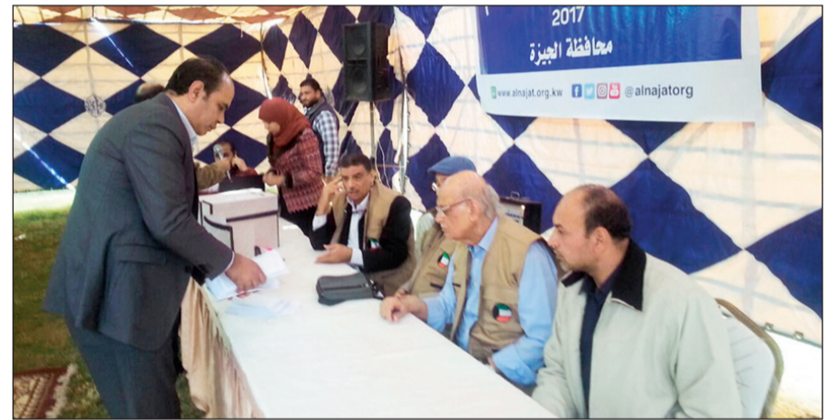
وقد النجاة، يشرف على توزيع كفاتلات الأيتام