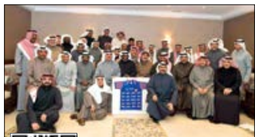
الغانم والحرمان مع نجوم الكرة (قاسم باشا)

لمشاهدة الفيديو يمكن استخدام QR كود أو الـ