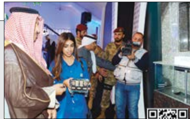
سور رئيس الوزراء الشيخ جابر المبارك يمشن مشاريع مجمع الزور الثقافي

لمشاهدة الفيديو يمكن استخدام QR كود أو الـ