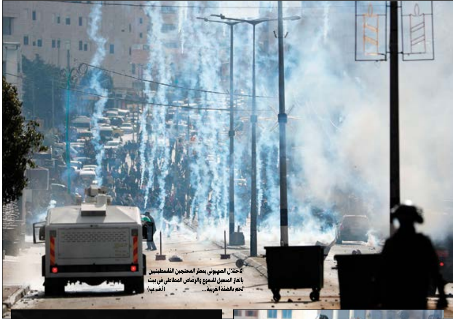
الاحتلال الصهيوني يطر المصحين الفلسطينيين بالغاز المسيل للدموع والرصاص المطاطي في بيت لحم بالضفة الغربية... (أ.ف.ب)

■ بغداد تستدعي سفير واشنطن وتسلمه مذكرة احتجاج و«النجباء» تهدد باستهداف القوات الأمريكية ■ حماس والجهاد تدعوان لانتفاضة جديدة.. واليوم جمعة غضب لنصرة القدس ■ جلسة طارئة لمجلس النواب اللبناني اليوم من أجل القدس ■ موسكو: القدس الغربية عاصمة لإسرائيل والشرقية لفلسطين ■ عائلة نيلسون مانديلا: الاضطهاد في فلسطين أشبه بـ «الأبارتايد»