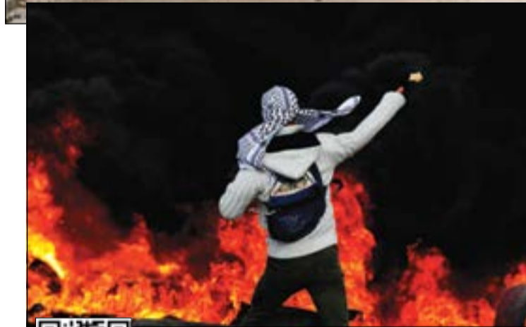
فلسطيني يرمي جنود الاحتلال بالحجارة في رام الله وسط الاطارات المشتعلة