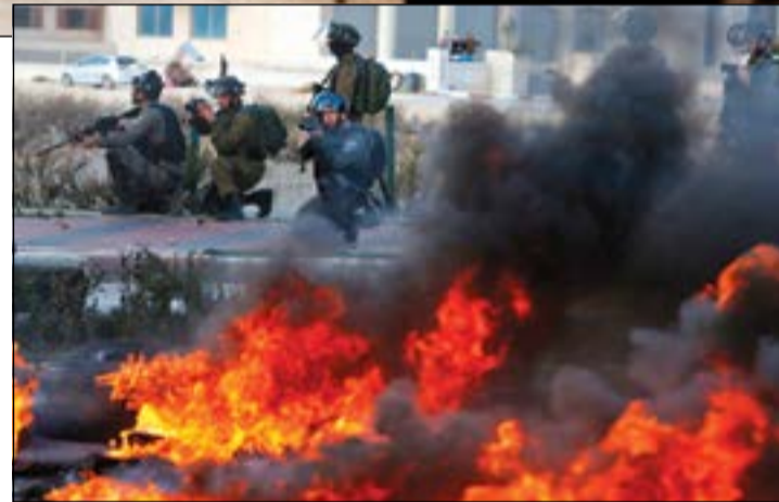
جنود الاحتلال بالسلاح الكامل في مواجهة المتظاهرين الفلسطينيين

عواصم - وكالات: اشتعلت الأراضى الفلسطينية والعديد من مدن العالمين العربي والإسلامي باحتجاجات ومسيرات غاضبة ومنذدة بقرار الرئيس الأمريكي دونالد ترامب الاعتراف بالقدس المحتلة عاصمة لإسرائيل ونقل السفارة الأمريكية إليها. وعم الإضراب الشامل الأراضى الفلسطينية المحتلة، واندلعت مواجهات بين الآلاف من الفلسطينيين وقوات الاحتلال في الضفة الغربية والقدس استخدمت خلالها الغازات المسيلة للدموع والرصاص الحي، وأسفرت عن وقوع العديد من الإصابات. ودعت حركة حماس إلى إطلاق انتفاضة غضب جديدة ابتداء من اليوم. وشهدت مدن أردنية عدة اعتصامات وتظاهرات غاضبة، أحرقت خلالها صور ترامب وعلم الولايات المتحدة هاتين «الموت لإسرائيل»، ودعا لإغلاق السفارة الأمريكية. كما شهدت مدن باكستانية وتركية وماليزية وعراقية ومصرية مظاهرات مماثلة طالبت باتخاذ مواقف حازمة من القرار الأمريكي الجديد، مؤكداً أن القدس ستبقى عاصمة لفلسطين. سياسياً، تصاعدت ردود الفعل المنسدة بالقرار، وأعلن الاتحاد الأوروبي رفض القرار مؤكداً أن أياً من دوله لن تنقل سفارتها إلى القدس. واستدعت عدة عواصم عربية السفراء الأمريكيين لتسليمهم مذكرات احتجاج على الخطوة. وهدد رجل الدين العراقي مقتدى الصدر إسرائيل بالوصول إلى أراضيها عبر سورية. هذا، ويعقد مجلس الأمن الدولي اجتماعاً طارئاً اليوم لبحث تداعيات الاعتراف الأحادي للرئيس الأمريكي دونالد ترامب بالقدس عاصمة لإسرائيل. ويأتي عقد هذا الاجتماع بناء على طلب تقدمت به بعثات كل من بوليفيا ومصر وفرنسا وإيطاليا والسنتغال والسويد وبريطانيا وأوروغواي حيث سيفتح الاجتماع بعرض حول آخر التطورات بشأن القدس بقمه الأمين العام للأمم المتحدة انطونيو غوتيريس. • التفاصيل ص 18 و19