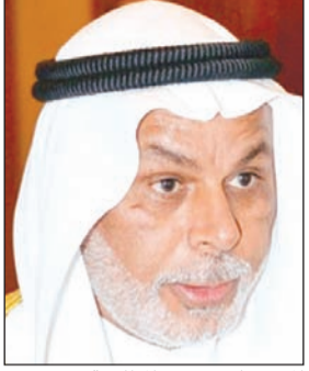
المستشار يوسف المطاوعة

الأساسية للمواطنين. وأرجعت المحكمة التي عقدت برئاسة المستشار يوسف المطاوعة، رفضها الطعن إلى أن الحكم البات الصادر بحق الطاعنين من محكمة التمييز انتهى إلى توافر جريمة الدعوة إلى الانضمام إلى جماعة محظورة مع العلم بالفرض الذي عمل له، وجريمة الانضمام إلى جماعة محظورة المؤتمنين بالمادة 30 من القانون 31 لسنة 1970 بشأن تعديل بعض أحكام قانون الجزاء من ضمن جرائم أخرى نسبت إلى الطاعنين في بنود الاتهام الأخرى.