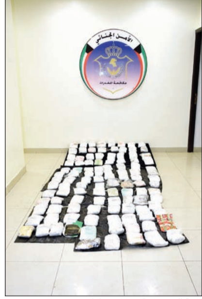
كمية الحشيش التي تم ضبطها

في إطار التنسيق المستمر بين هيئة الاستخبارات والأمن بوزارة الدفاع وبين قطاع الأمن الجنائي متمثلاً بالإدارة العامة لمكافحة المخدرات والإدارة العامة لخفر السواحل تم ضبط 110 كيلو غرامات من مادة الحشيش المخدرة حاول مواطنان تهريبها عبر البحر إلى داخل البلاد بالتواطؤ مع عدد من الإيرانيين. كانت المعلومات الواردة من هيئة الاستخبارات والأمن بوزارة الدفاع قد أشارت إلى وجود عملية تهريب كمية كبيرة من المخدرات عبر البحر بواسطة مواطنين كويتي يبلغ من العمر 42 عاماً ومن أرباب السواحل في قضايا الاتجار بالمخدرات وأن عملية التهريب ستتم مساء أول امس الثلاثاء فتمت عملية المراقبة من قبل قطاع الأمن الجنائي (الإدارة العامة لمكافحة المخدرات) والإدارة العامة لخفر السواحل، واتخاذ الإجراء القانوني اللازم. وتمت متابعة المشتبه به ومعهم شريك آخر مواطن أيضاً عند وصولهما إلى مسنة القطاس، وتم ضبطهما وبحوزتهما 110 كيلو غرامات من الحشيش كما قامت الإدارة العامة لخفر السواحل بضبط خمسة من الإيرانيين على النج الذي كان يحمل المخدرات. وجار إحالة المتهمين والمضبوطات إلى جهة الاختصاص.