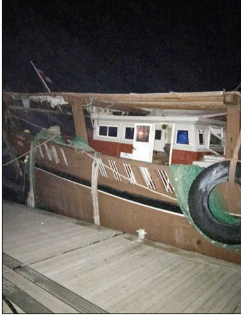
النجش الإيراني في مقر خفر السواحل