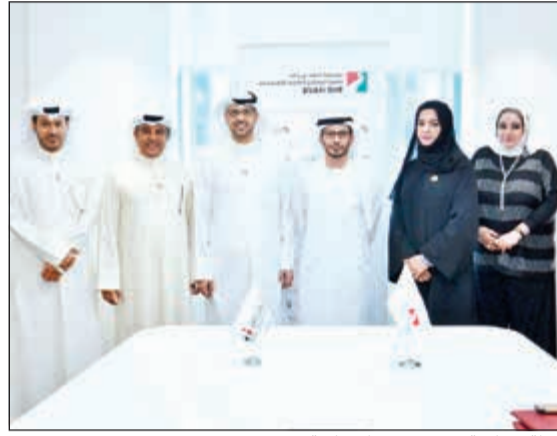
لقطة جماعية عقب توقيع الاتفاقية

دولة الإمارات والكويت نحو النمو والاستثمارية. ونفتخر بدعم أشقاؤها رواد الأعمال الشباب وتعزيز ضمان حصول أصحاب المشاريع الصغيرة والمتوسطة على التسهيلات اللازمة في سبيل مزاولة أعمالهم. وتقوم المؤسسة بتقديم الدعم للمشاريع المتكبرة، التي يقودها نخبة رواد الأعمال الشباب من الكويت، والحرص على متابعة خطى عملهم، وتقديم الأدوات اللازمة من حيث الخدمات الاستشارية والتدريبية. وأضاف المري: «توفر المؤسسة البرامج والمبادرات الجديدة المشتركة مع المؤسسات التنموية في الكويت، بهدف تعريف الكفاءات منهم بالخدمات التي توفرها للوصول إلى أكبر شريحة من الراغبين بالنهوض لمشاريعهم من خلال إمارة دبي، وبالتالي المساهمة بدور فعال في تعزيز نمو الاقتصاد الوطني، والكويتي بشكل عام، وأكد استعداد فريق العمل من المؤسسة للتعاون مستقبلاً في مبادرات مشتركة