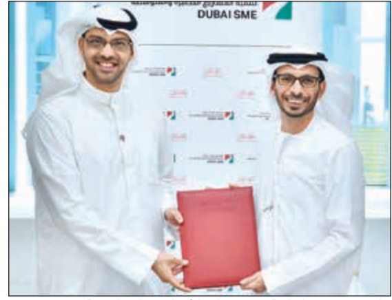
جانب من توقيع اتفاقية تعزيز ريادة الأعمال وتبادل المعرفة

وقعت مؤسسة محمد بن راشد لتنمية المشاريع الصغيرة والمتوسطة، إحدى مؤسسات الاقتصادية في دبي، ومجلس الأعمال الكويتي ببني الإمارات الشمالية، اتفاقية تعاون تهدف إلى تعزيز ريادة الأعمال وتبادل المعرفة في مجال دعم المشاريع الصغيرة القائمة أو الراغبة في التواجد في إمارة دبي. كما تنص الاتفاقية على تمكن رواد الأعمال وتشجيعهم على تبادل المعلومات والخبرات ضمن نطاق عمل الجهتين.