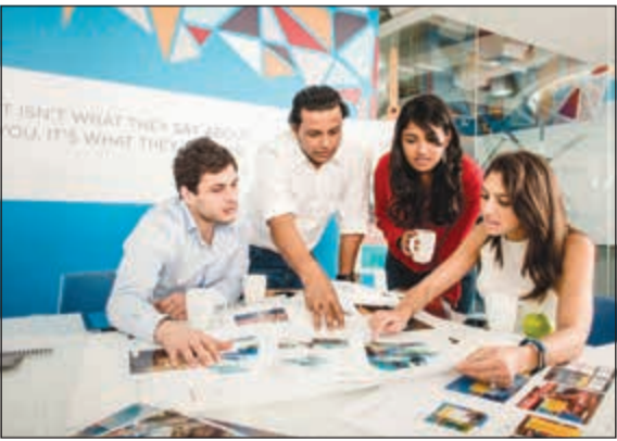
فريق عمل أصداء بيرسون- مارستيلر