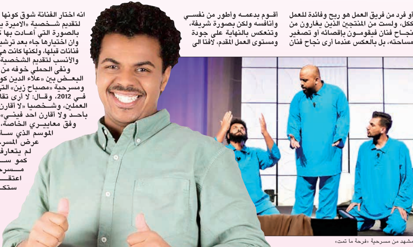
مشهد من مسرحية «فرحة ما تمت»

أو فرد من فريق العمل هو ربح وفائدة للعمل ككل، ولست من المنتجين الذين يغارون من نجاح فنان فيقومون بإقصائه أو تصغير مساحته، بل بالعكس عندما أرى نجاح فنان