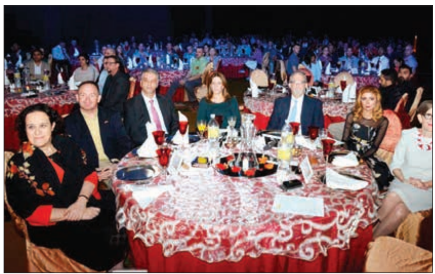
السفير الأميركي لورانس سيلفرمان وحرمة ونائبة السفير الأميركي ناديا مياهي وتوفيق جوهره وحرمة

والسالمي ونسعى لتركيبها وتشغيلها في جميع المنافذ المسموح بها. وفيما يخص الأجهزة الأمنية، أشار إلى أنه تم توزيع أكثر من جهاز للطرد البريدية حيث وفرنا 3 أجهزة (إي سكان) في الجواله بميناء الشويخ والطرد البريدية في الصديق ومطار الكويت الدولي، موضحا أنه تم توفير جهاز جديد (الماسح) خاص بالمواد المخدرة وكل الممنوعات الأخرى، مشيرا إلى أن أجهزة الماسح قادرة على اكتشاف المخدرات حتى وإن كان الشخص قد أمسك بها، أي من آثارها على راحة البدن، إلى جانب تركيب كاميرات بجميع المواقع الجمركية في ميناء الشويخ والشويخ والدوحة والمطار والأثر وبدوان الإدارة ومركز الصديق، وبمسدود الانتهاء من تركيب 80 كاميرا بموقع الصليبية، وكذلك بصدد اعتماد جميع مواصفات ومواقع تركيب الكاميرات بـ (السالمي والنويصيب وسترال حطين) خلال أيام. ونفى العيدان ما يشاع في بعض وسائل التواصل الاجتماعي بأن الإدارة العامة للجمارك تستعين بالكاميرات لمراقبة موظفيها، مؤكدا أنه عار تماما من الصحة، بل تتم مراقبة الموقع الجمركي والشاحنات وحركة سير المنفذ وجميع الأماكن التي توجد بها البضائع أمينا لاتخاذ القرار، لافتا إلى أن الموظف مؤتمن على تلك المواقع للحفاظ على أمن وسلامة البلاد. وأوضح أن الكاميرات الأمنية هي عامل مساعد للضبط داخل المنفذ ومتابعة كل ما يحدث بداخله، إلى جانب المشروع القائم بتوفير أحدث الأجهزة لتفتيش الشاحنات في منفذ النويصيب والسالمي خلال الفترة المقبلة، مشيرا إلى حرص الإدارة العامة للجمارك