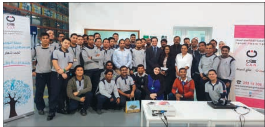
مجموعة من موظفي شركة حبشي وشلهوب في صورة جماعية على هامش المحاضرة