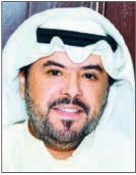
الشيخ علي الخليفة