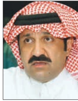
الشيخ أحمد اليوسف

العام الأمر الذي ستكون له نتائج إيجابية خلال المستقبل القريب.