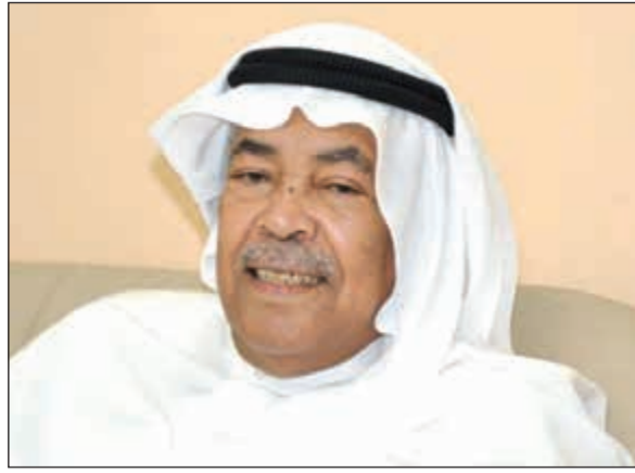
الفنان القدير سعد الفرج