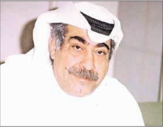
الراحل عبدالأمير التركي