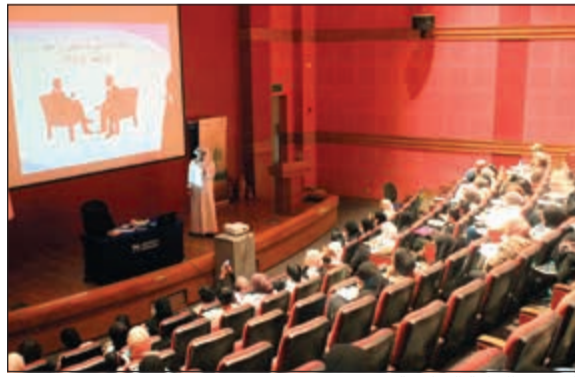
جانب من الحلقة النقاشية

نظم نادي القراءة في كلية بوكسهول الكويت حلقة نقاشية مع الكاتبة الكويتية سعد البدر، حيث ناقشت عضوات النادي كتابه «ثم هوى»، وتطرقن مع الكاتبة للعديد من القضايا الاجتماعية والنفسية المهمة.