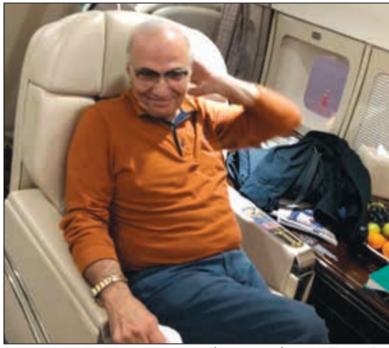
لقطة متداولة للفريق أحمد شفيق أثناء عودته من الإمارات إلى القاهرة