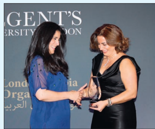
الشيخة انتصار سالم العلي أثناء تكريمها