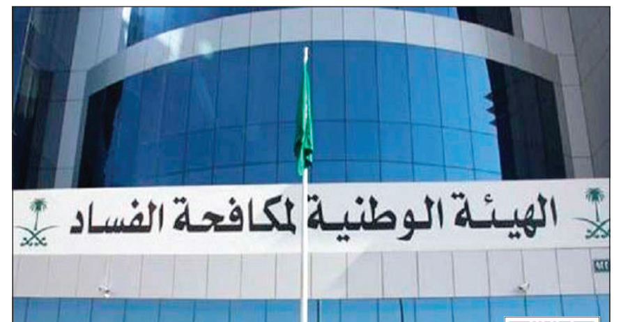
مبنى الهيئة الوطنية لمكافحة الفساد السعودية

لجنة مكافحة الفساد حصلت على موافقات ملكية بإتمام التسويات المالية