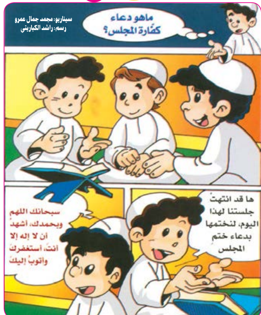
سيناريو: محمد جمال عمرو رسم: راشد الكباريني