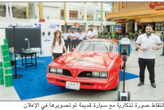
التقاط صورة تذكارية مع سيارة قديمة تم تصويرها في الإعلان

يستمر إلى الغد في الأقنيوز - المرحلة الثانية