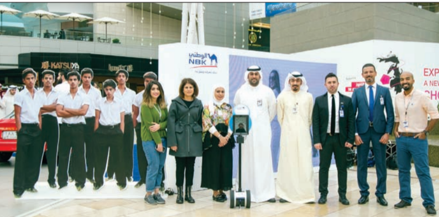
لقطة لموظفي «الوطني» في جناح البنك بالأقنيوز

معكم، بمناسبة ذكرى تأسيس البنك في العام 1952، وقد تم اختيار مضمون الإعلان من مشاهد قديمة ورمزية عن كل مرحلة من مراحل العقود الماضية التي عاصرتها الكويت لتعكس مواكبة البنك لهذه المراحل وتظهر مدى عمق العلاقة المستمرة التي تجمع البنك بعملائه والتي تتخلل من جيل إلى جيل، على مدى 6 عقود ونصف. ويتواصل عرض الإعلان على القنوات التلفزيونية وصالات السينما، وموقع البنك على قناة يوتيوب وفيسبوك، إلى جانب صفحات «الوطني» على إنستغرام وتويتر @NBKGroup.