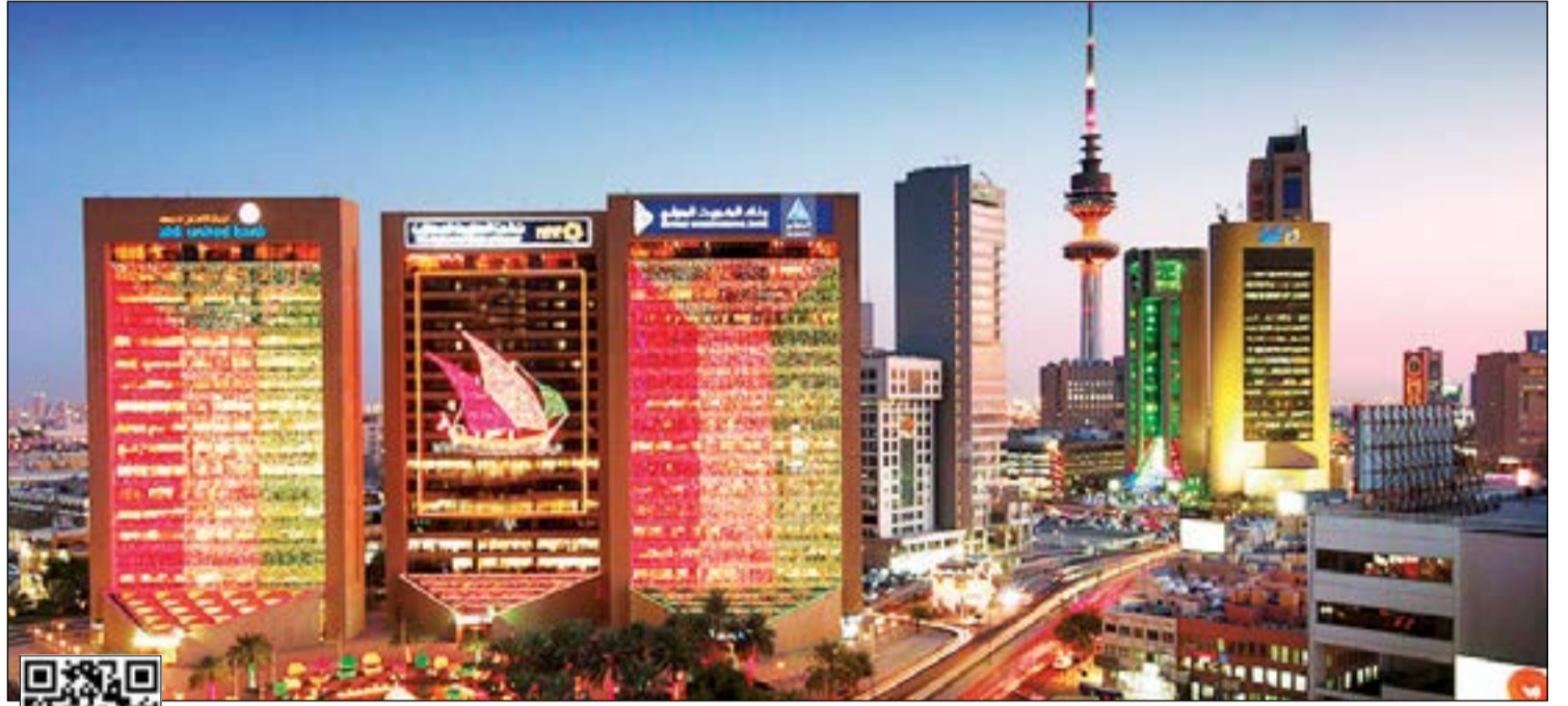
لمشاهدة الفيديو يمكن استخدام QR كود أو الـ

أوراق المالية الحكومية تمثل 9% من إجمالي الأصول المصرفية الكويتية