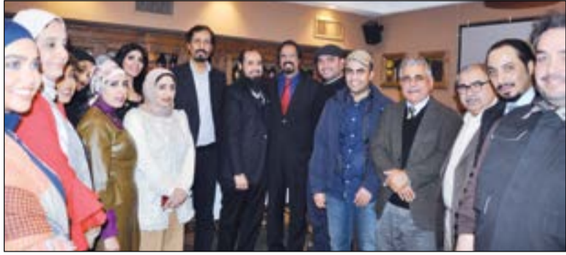
السفير الشيخ علي الخالد متوسلا للمهندسين والمهندسات خلال حفل الاستقبال

داعين المولى عز وجل أن يطيل عمر سموه ويمدده بموفور الصحة والعافية. وأضاف العتلي: أن حرص السفير الخالد على لقائنا والوفود الخليجية كمنظمة مهني يؤكد التوجه الرسمي للكويت في أن يكون عملنا واحدا من مقومات التعاون الخليجي، وذلك يؤكد الدور الكبير لنا كمؤسسات تطوعية في دعم جهود الكويت لتحقيق المصالحة بأقرب وقت ممكن بقيادة صاحب السمو. وتابع: اطلعنا السفير الشيخ علي الخالد على ما يقوم به المهندسون من أعمال تطوعية في لجان الاتحاد الدولي للمنظمات الهندسية ودورهم على الساحطين الدولية والإقليمية، مضيفا انه تم الاتفاق على فتح قنوات للتعاون في 3 مجالات رئيسية وفتح باب الاعتماد للجامعات الإيطالية العريقة في الكويت وخاصة تلك المعنية بتخصص جمعية المهندسين، كما اتفقتنا على استمرار التواصل والتعاون لإيجاد فرص لتدريب المهندسين الكويتيين في كبريات الشركات الإيطالية وخاصة حديثة التخرج، بالإضافة إلى تكريس التعاون مع الجمعيات المهنية الهندسية الإيطالية.