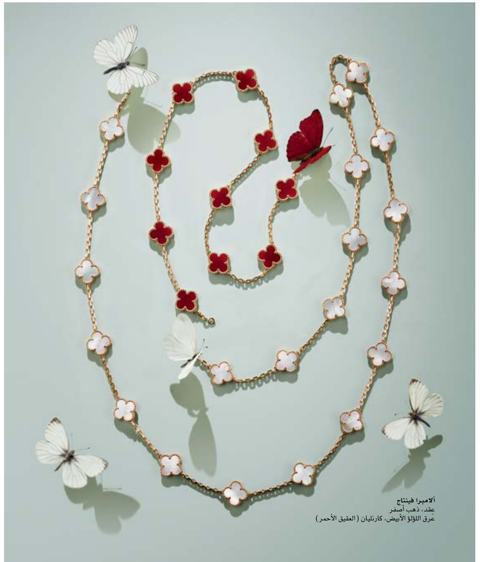
الأميرة فينتاج عقد، ذهب أصفر عرق اللؤلؤ الأبيض، كارنيليان (العقيق الأحمر)