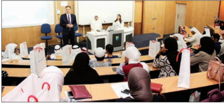
جانب من المحاضرة

مع كل فئات المجتمع خاصة من ناحية الدعم الاجتماعي والمسؤولية الاجتماعية. من جانبهم، أشاد أساتذة كلية العلوم الإدارية والمشاركين في المحاضرة بمبادرة «الوطني للاستثمار»، مؤكدين أهمية إرساء الثقافة الاقتصادية بشكل عملي للطلبة لمساعدتهم على فهم الواقع الحقيقي للاقتصاد المحلي والإقليمي والعالمي.