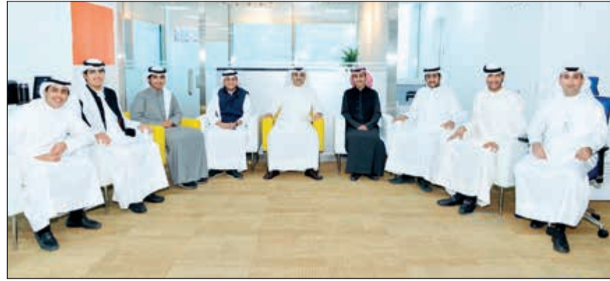
التوجيهي مع الشباب المكرمين

من مسؤوليته الاجتماعية يولي الشباب أهمية خاصة سواء من خلال الفعاليات والأنشطة التي ينظمها بصورة مستمرة لهم أو من خلال المنتجات والخدمات التي يقدمها لهم. من جانبهم، أعرب الشباب عن تقديرهم وشكرهم لإدارة بنك بوبيان والتي كانت من أولى المؤسسات التي قدّرت جهودهم وكرمهم، وهو الأمر الذي لا يعد غريباً عن بنك بوبيان راعي الشباب الكويتي المبتكر. وأضافوا أن بنك بوبيان يعتبر مثلاً للمؤسسات المحلية التي أثبتت قدرتها على التطور وبما يحقق للشباب طموحاتهم، مؤكداً أن ما