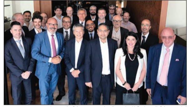
إدارة شركة الفروانية للتطوير العقاري مع شركة «إيتينيرا غنتوت»

التجلية الجديدة في أبوظبي. جدير بالذكر أنه يتم تطوير المجمع من قبل شركة الفروانية للتطوير العقاري، وهي مشروع مشترك بين 3 شركات كويتية هي شركة إيجيبيتي، وشركتها التابعة المشاريع المتحدة للخدمات الجوية (يوبك)، والشركة الوطنية العقارية. وتوفر هذه الشراكة للمشروع أساساً مالياً متيناً وخبرة عميقة في إدارة الأصول وتطوير العقارات التجارية.