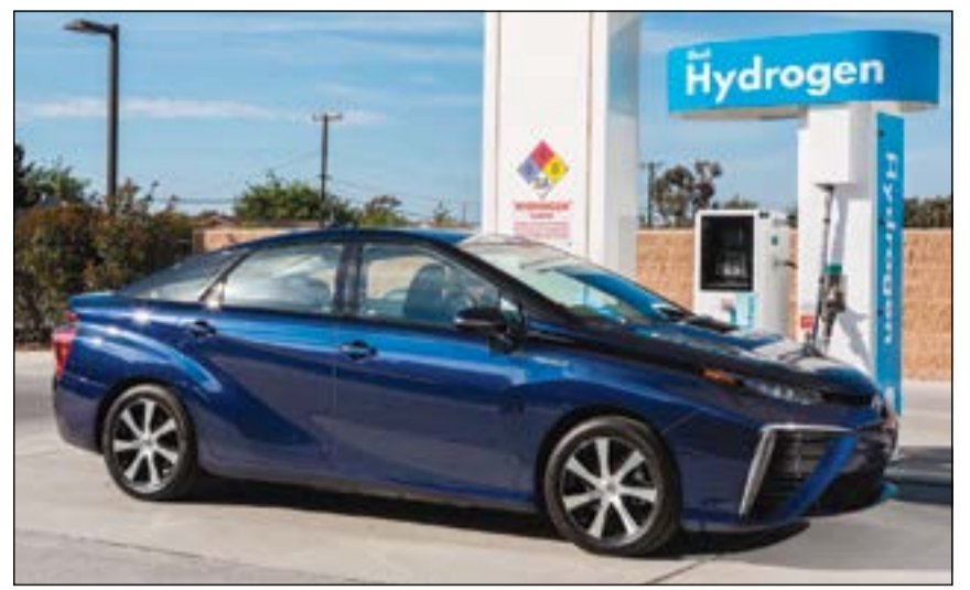
ميراي إحدى سيارات «تويوتا» العاملة بالهيدروجين