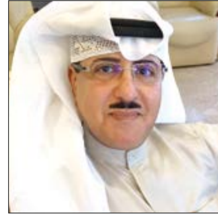
الشيخ فهد المبارك الصباح