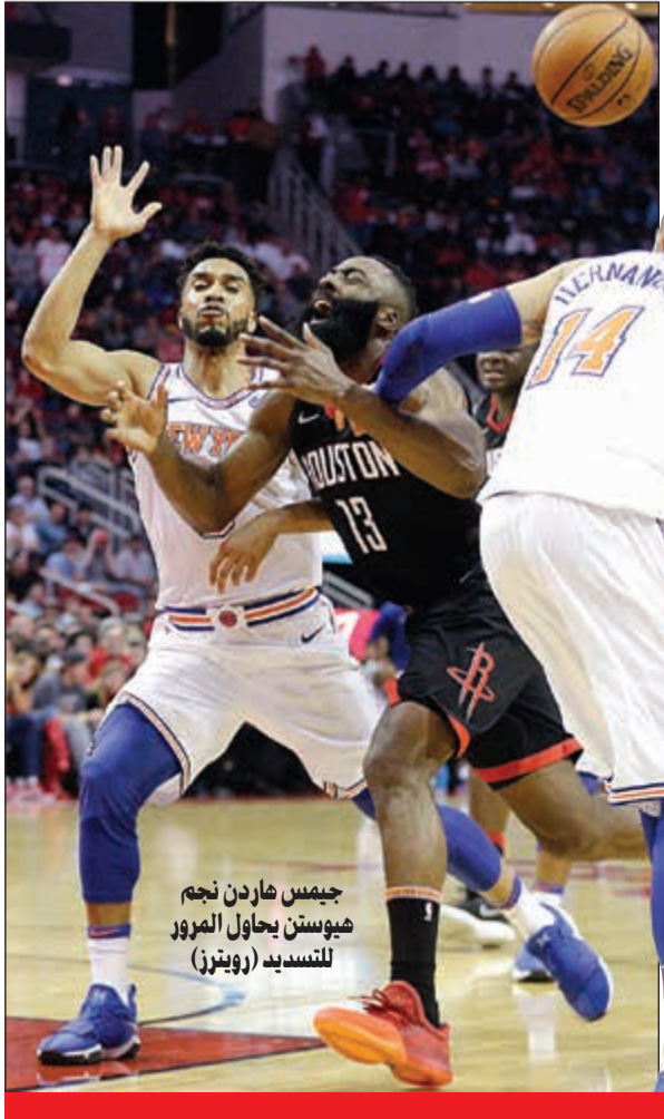
جيمس هاردن نجم هيوستن يحاول المرور للتسديد

عزز بوسطن سلتيكس وهيوستن روكتس صدارتهما للمنطقتين الشرقية والغربية، فيما تجاوز ستيفن كوري أسوأ بداية مباراة في مسيرته وفاد غولدن ستايت ووريترز للفوز في دوري كرة السلة الأميركي للمحترفين. على ملعب «بانكرز لايف فليدهاوس»، عزز بوسطن سجله كأفضل فريق في الدوري حتى الآن، وذلك بتحقيقه فوزه الثامن عشر وجاء على حساب مضيغة إنديانا بيسرز 108-98. ودخل بوسطن إلى اللقاء وهو يبحث عن بدء سلسلة جديدة من الانتصارات بعدما انتهت سلسلته الأولى عند 16 انتصارا متتاليا بخسارته الأربعة أمام ميامي هيت، وهو نتج في تحقيق مبتغاه بتحقيق فوزه الثاني تاليا والثامن عشر في 21 مباراة بفضل الغدائي كايري إيرفينغ وآل هورفورد. بدوره، حقق غولدن ستايت ووريترز حامل اللقب فوزه الثاني تاليا بغياب نجمه المصاب كيفن دورانت، وجاء على حساب مضيغة نيو أورليانز بيليكنز 110-95 بفضل نجمة الآخر ستيفن كوري الذي تجاوز ديانته الصعبة جدا في المباراة، حيث أخفق في محاولاته العشر الأولى، وأنهى اللقاء بـ 27 نقطة، بينما 14 في الربع الثالث، وواصل هيوستن روكتس عروضه المميزة هذا الموسم وعزز صدارته للمنطقة الغربية بفوزه الخامس عشر في 19 مباراة، وجاء على حساب مضيغة نيويورك نيكس 117-102. وتغلب سان أنتونيو سبيرز على نيو تشارلوت هورنتس 106-86، وفيلادلفيا سفنتي سيكسرز على أورلاندو ماجيك 130-111. كما تغلب بورتلاند ترابل بلايزرز على واشنطن ويزاردز 108-105، وتورونتو رابتورز على أتلانتا هوكس 112-78، وبلاس مافريكس على أوكلاهوما سيتي ثاندر 97-81، ويوتا جاز على ميلووكي باكس 121-108، ولوس أنجلوس كليبرز على ساكرامنتو كينغز 97-95.