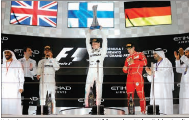
بوتاس يتوسط فيتل وهاميلتون على منصة التتويج

فاز فالتيري بوتاس بالسباق الختامي لبطولة العالم فورمولا 1 للسيارات هذا الموسم في أبوظبي بعدما انطلق من الصدارة وتفوق على زميله لويس هاميلتون البطل الذي اكتفى بالمركز الثاني أمس. وهذا الانتصار الثالث للسائق الفنلندي بوتاس هذا الموسم ومنع زميله هاميلتون من عاشر فوز في 2017. واحتل سباستيان فيتل سائق فيراري المركز الثالث لحفاظ على المركز الثاني في ترتيب بطولة العالم للسائقين خلف البريطاني هاميلتون الذي ضمن التتويج الشهر الماضي في المكسيك، وسبق لمرسيدس أن حسم لقب بطولة العالم للمصانعين للمرة الرابعة على التوالي. وهذه المرة يهيمن فيها مرسيدس على أول مركزين بالسباق خلال الموسم الجاري.