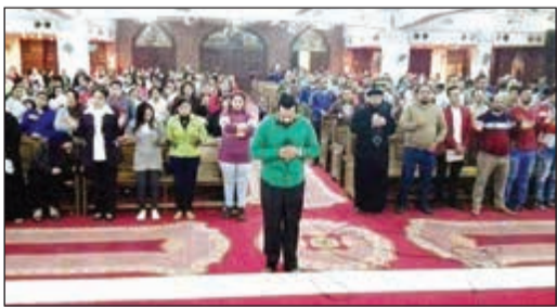
لقطة تظهر مجموعة من الأقباط خلال إقامة صلاة الغائب