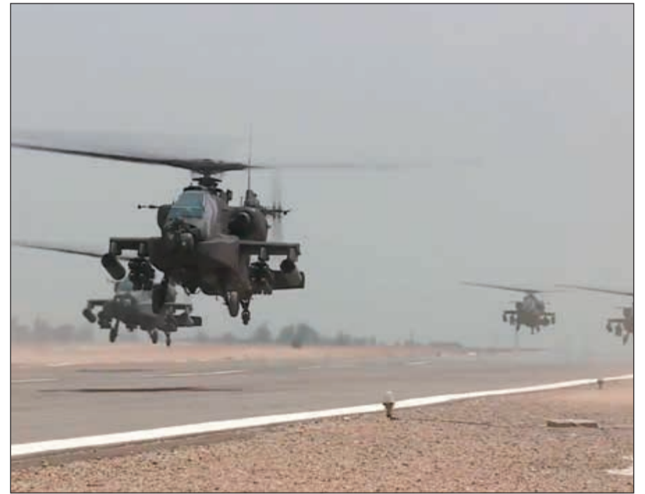
الغارات الجوية مستمرة في استهداف منفذ الهجوم الإرهابي على مسجد الروضة

إلى ذلك، يعقد مجلس النواب اليوم جلسة طارئة لبحث كيفية الرد على مجزرة المسجد التي حصدت حتى الآن 305 شهداء منهم 27 طفلاً وإصابة 128 آخرين، ومن بين التشريعات التي يطلب النواب باستعجال مناقشتها، مشروع قانون الإجراءات الجنائية الذي يجيز مراقبة الاتصالات السلكية واللاسلكية، وحسابات مواقع التواصل الاجتماعي، والبريد الإلكتروني، والرسائل النصية أو المصورة على الهاتف، أو إجراء تسجيلات لأحداث جرت في أماكن خاصة لمدة لا تزيد عن 30