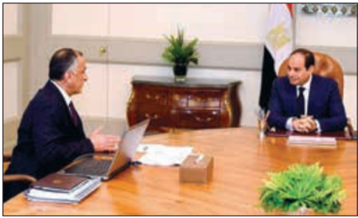
الرئيس عبدالفتاح السيسي يجتمع مع طارق عامر