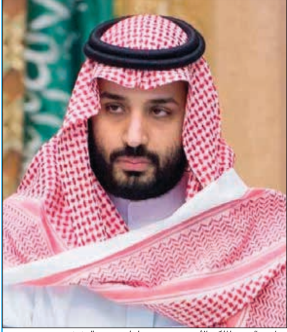
صاحب السمو الملكي الأمير محمد بن سلمان بن عبدالعزيز

الرياض - د.ب.أ: يفتتح اليوم صاحب السمو الملكي الأمير محمد بن سلمان بن عبدالعزيز ولي العهد نائب رئيس مجلس الوزراء وزير الدفاع السعودي، أعمال الاجتماع الأول لمجلس وزراء دفاع التحالف الإسلامي العسكري لمحاربة الإرهاب، الذي ينعقد تحت شعار «متحالفون ضد الإرهاب»، بمشاركة وزراء دفاع 41 دولة ووفود دولية وبعثات رسمية من الدول الداعمة والصدقية. وسيشهد الاجتماع مشاركة عدد من الخبراء المتخصصين في مجالات عمل التحالف الإسلامي، حيث سيلقي الشيخ د.محمد العيسى، أمين عام رابطة العالم الإسلامي كلمة رئيسية حول المجال الفكري. ويهدف هذا المجال الفكري إلى المحافظة على عالمية رسالة الإسلام الخالدة، مع التأكيد على المبادئ والقيم الإسلامية كالاتحاد والتسامح والرحمة، التصدي لنظريات وأطروحات الفكر الإرهابي من خلال إيضاح حقيقة الإسلام الصحيح، وإحداث الأثر الفكري والنقسي والاجتماعي لتصحيح هذه المفاهيم الإرهابية المتطرفة. ويهدف التحالف في المجال الإعلامي إلى المساهمة في تطوير وإنتاج ونشر محتوى تحريري واقعي، وعلمي، وجذاب لاستخدامه في منصات التواصل والقنوات الإعلامية التابعة للتحالف أو من خلال أطراف أخرى، بهدف فضح وهزيمة الدعاية