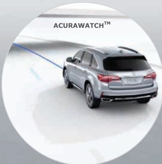
نظام البقاء على الطريق (RDM)