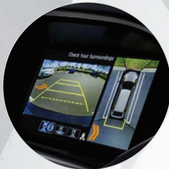
منظومة كاميرات خلفية وامامية وجانبية (CTM)