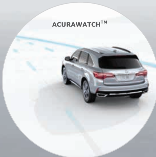
نظام عدم الخروج من الحارة (LKAS)