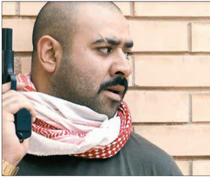
بشار الشطي في مشهد من الفيلم

على دعم الفيلم بعرضه في مهرجان القاهرة، حيث قال إنه يعتبر الفيلم علامة مضيئة في مسيرته، موجهًا الشكر لمصر، مترجماً على الشهداء بعد حادث مسجد الروضة. وأضاف داود أنه يتمنى أن تصل أفلام الخليج إلى مصر، مؤكداً أن أي فنان عربي يريد أن ينتشر يأتي إلى مصر لأنها هوليوود العرب، بينما وجه الفنان الكويتي أحمد إبراهيم الشكر للمهرجان لأنه أتاح الفرصة للعرض في المهرجان. يذكر أن قصة الفيلم مستوحاة من قصة حقيقية حول ملحمة وطنية لمجموعة من المقاومة الكويتية أثناء فترة الغزو العراقي على الكويت، حيث تتمركز المجموعة في منزلهم الذي يتم اكتشافه من قبل القوات العسكرية العراقية فتقوم بالهجوم على المنزل والاشتباك معهم بالذخائر بسبب رفضهم للاستسلام، دفاعاً عن أرضهم.