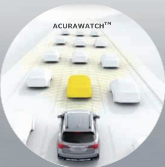
نظام مثبت السرعة المتكيف (ACC)