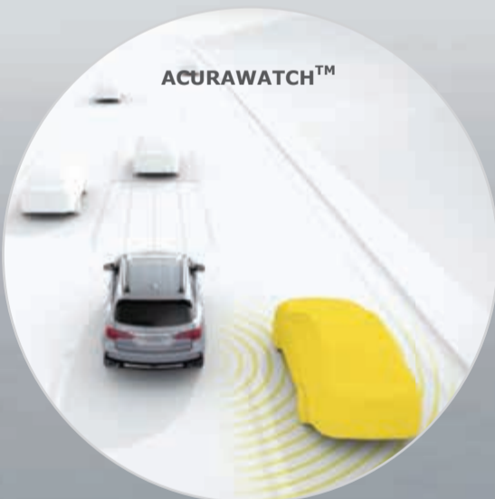
نظام إظهار النقطة العمياء (BSI)