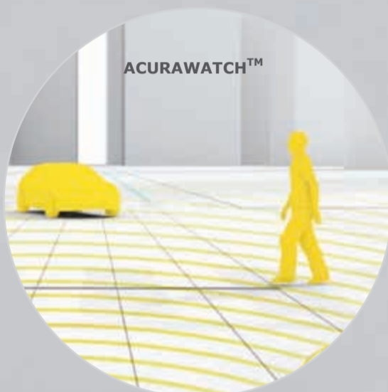
نظام منع وتخفيف حدة الاصطدام الامامي (CMBS™)