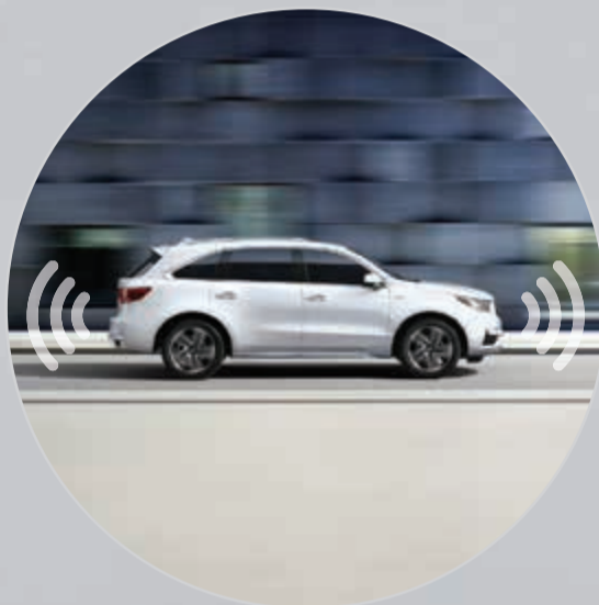
سنسرات امامية وخلفية