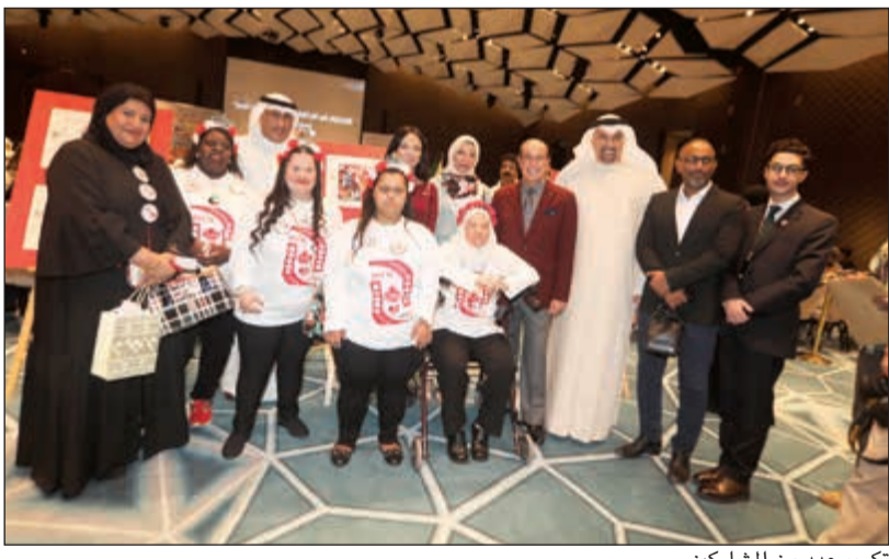
تكريم عدد من المشاركين