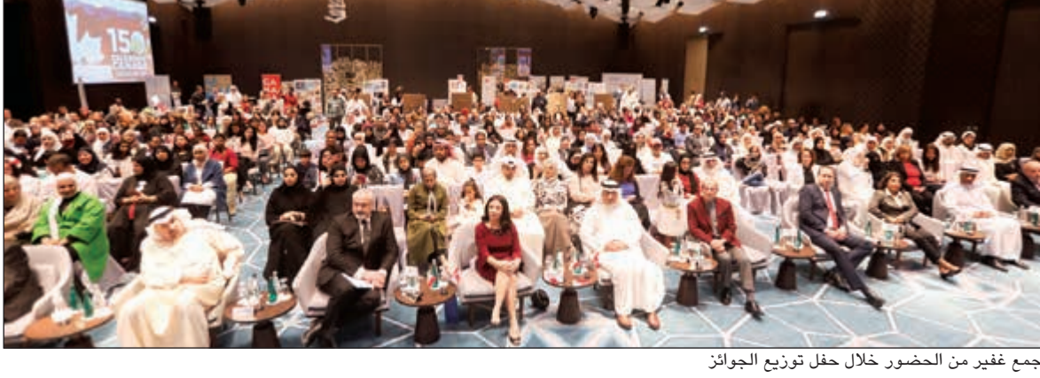
جمع غير من الحضور خلال حفل توزيع الجوائز