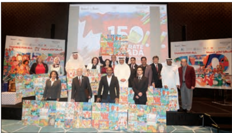
عرض اللوحات الفائزة