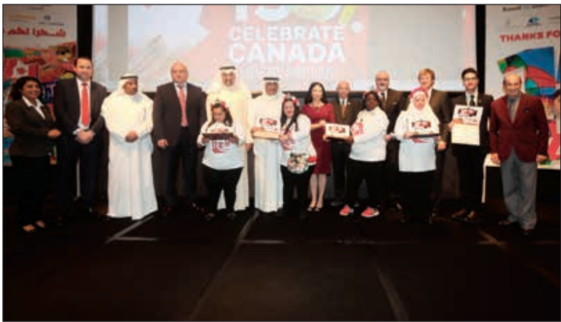
عدد من الطلبة الفائزين مع الحضور