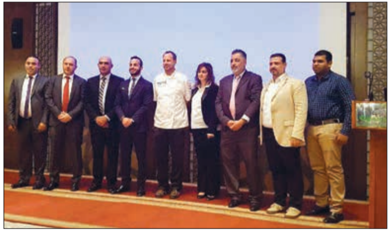
الشيف باركهورن يتوسط المديرين في الشركتين المنظمين للحدث

نظمت شركة البروتين الكويتية بالتعاون مع شركة «سي اس ام» الرائدة عالمياً في قطاع صناعة المخبوزات والحلويات CSM Bakery Solutions، سيمينار في فندق «هوليدي ان السالمية»، قدمه وأداره الشيف الألماني العالمي كلينس باركهورن، تضمن شرحاً تفصيلياً عن إعداد أخصر أنواع المخبوزات والحلويات بمذاقات مختلفة ومتميزة ترضي جميع الأذواق، وذلك بحضور عدد كبير من أمهر الطهاة في الكويت، الذين استمتعوا بمتابعة تحضير وتذوق أنواع مبتكرة من المخبوزات المألحة والحلوة، بمكونات عالية الجودة والمتوافرة لدى شركة البروتين الكويتية حصرياً.