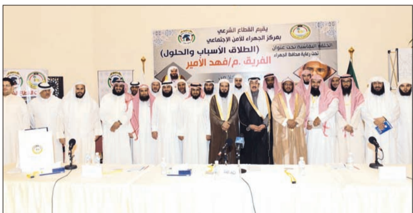
فهد الأمير متوسطا د.علي الشبيلي ود.عبد اللطيف الغامدي وأبور الظفيري وعددا من الحضور

يضم القطاع الشرعي بمركز الجهراء للأمن الاجتماعي حلقة نقاشية بعنوان «الطلاق.. الأسباب والحلول» برعاية محافظ الجهراء الفريق فهد الأمير والتي قدمها كل من المحاضر في جامعة الإمام د.علي الشبيلي ورئيس مركز إصلاح ذات البين في السعودية د.عبد اللطيف الغامدي، وذلك في قاعة القصر الأحمر.