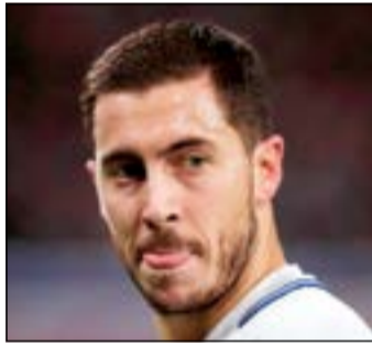
النجم البلجيكي

كتب الدولي البلجيكي إدين هازارد نجم تشلسي التاريخ خلال فوز البلوز على كارايخ بنتيجة 4-0 في الجولة الخامسة من دور المجموعات بدوري أبطال أوروبا. وسجل هازارد الهدف الأول من ركلة جزاء ثم صنع الهدف الثاني لويليان. وكشف موقع أوبتا للإحصائيات أن هازارد سجل هدفة رقم 8 في المسابقة ليصبح أكثر لاعب بلجيكي تسجيلا للأهداف في البطولة. ولأول مرة يقوم هازارد بتسجيل وصناعة أهداف في مباراة واحدة بدوري الأبطال في مسيرته.