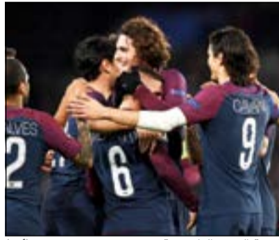
كتيبة الرعب الباريسية

واصل فريق باريس سان جرمان سطوته في دوري الأبطال، إذ ظهر الفريق الفرنسي بشكل قوي للغاية منذ انطلاقه المنافسات الأوروبية بالموسم الحالي. وسجل بي أس جي سبعة أهداف في مرمى سلتيك الاسكتلندي ليصل الفريق الفرنسي إلى الهدف رقم 24 في 5 مباريات خاضها حتى الآن. وذكرت صحيفة ليكيب أن سان جيرمان أصبح أكثر فريق يسجل أهدافا في دور المجموعات بالأبطال على مر التاريخ، متفوقا على بروسيا دورتموند الذي سجل الموسم الماضي 21 هدفا.