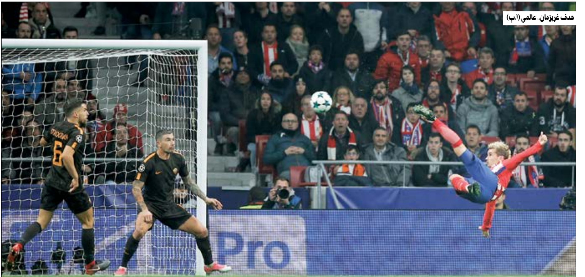
هدف غريزمان.. عالمي