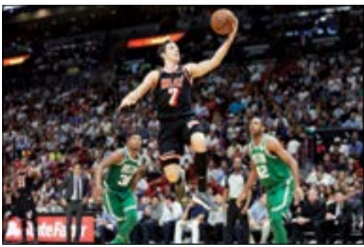
قفزة رائعة من دراجيك

أنهى ميامي هيت سلسلة من 16 انتصارا متتاليا لبوسطن سلتيكس وفاز عليه 104-98 في دوري كرة السلة الأمريكي للمحترفين، فيما خرج راسل وستبروك نجم أوكلاهوما فائزا من مواجهة حامية مع زميله السابق كيفن دورانت هدف غولدن ستيت حامل اللقب. في المباراة الأولى على ملعب «أميريكان إيرلاينز ارينا»، برز مع ميامي المضيف السلوفيني غوران دراغيتش (27 نقطة) وديون وابتيرن (26 نقطة)، ليحقق ميامي فوزه الثامن مقابل 9 خسارات، ويتعرض لبوسطن متصدر الدوري لخسارته الثالثة فقط هذا الموسم والأولى منذ 18 أكتوبر مقابل 16 فوزا. وفي الثانية على ملعب «تشيزبيك انرجي ارينا»، نجح أوكلاهوما سيتي المضيف في تخطي غولدن ستيت ووريز 108-91، في مباراة شهدت مناوشات كلامية قوية بين موزع الأول راسل وستبروك وهدف الثاني كيفن دورانت اللذين قادا سيتي إلى نهائي 2012. وفي كليفلاند، سجل «الملك» ليبرون جيمس 23 من نقاطه الـ 33 في الربع الأخير ليقود كافاليرز إلى فوزه السادس على التوالي على حساب بروكلين نتس 119-109.