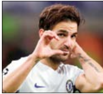
الإسباني فابري

سجل الإسباني سيسك فابريغاس لاعب نادي تشلسي الهدف الثالث لفريقه أمام كارايخ الأذربيجاني من ركلة جزاء في دوري الأبطال. وقالت صحيفة غارديان إن سيسك أصبح رابع لاعب إسباني يسجل 20 هدفا أو أكثر في التشامبيونزليغ. وأشار حساب «ميستر شيب» الإسباني إلى أن فابريغاس عادل رقم فرناندو توريس صاحب الـ 20 هدفا في المسابقة ويتفوق عليهما فرناندو مورينتيس برصيد 33 هدفا، بينما يحتل راؤول غونزاليس الصدارة برصيد 71 هدفا.