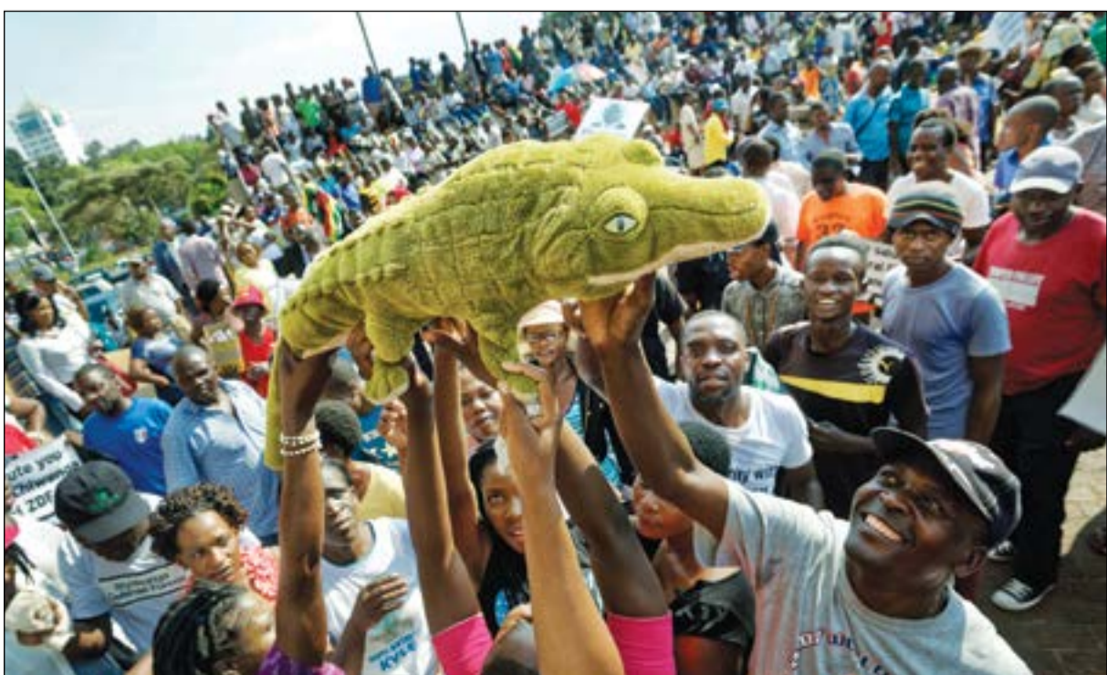
انصار مانغاغوا يرفعون مجسماً لتمساح حيث يعرف بهذا اللقب خلال تظاهرة مؤيدة له امس الاول

وفي سياق متصل، قالت مصادر مطلعة إن موغابي حصل على حصانة من الملاحقة القضائية وضمانات بتوفير الحماية له داخل البلاد في إطار اتفاق أدى لاستقالته. وقال مصدر حكومي إن موغابي (93 عاماً) قال للمفاوضين قبيل استقالته إنه لا يرغب في الموت في زيمبابوي ولا يخطط مطلقاً للعيش في المنفى. ويضع رحيل موغابي زيمبابوي في موقف مختلف عن عدد من الدول الأفريقية الأخرى، حيث أصبح زعماء قدامى في انتفاضات شعبية أو عبر الانتخابات. ويبدو أن الجيش رتب لمسار خال من المتاعب لانتقال السلطة إلى مانغاغوا الذي كان على مدى عقود مخلصاً لموغابي وعضواً بدائرتة المقربة. وكان مسؤولاً أيضاً عن الأمن الداخلي عندما قالت جماعات حقوقية إن 20 ألف