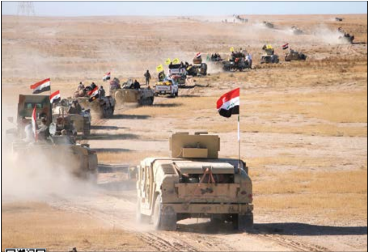
مدرعات للقوات العراقية والحشد الشعبي خلال تقدمها في الصحراء الغربية لتعقب فلول «داعش» امس

مدرعات للقوات العراقية والحشد الشعبي» خلال تقدمها في الصحراء الغربية لتعقب فلول «داعش» امس