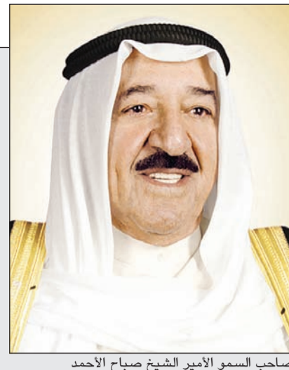
صاحب السمو الأمير الشيخ صباح الأحمد

سبل اتصالات ورسائل من قادة وزعماء العالم للاطمئنان على صحة صاحب السمو.. وولي العهد للأمير: نجاح الفحوصات الطبية أثلج صدورنا وصدور أهل الكويت الأوفياء 02