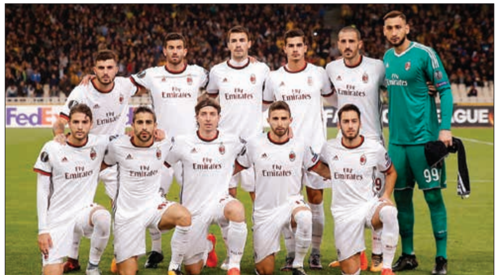
ميلان لتسليح خيبته في الكالتشيو

يتأخر بفارق 7 نقاط خلف سميدوريا السادسة. وستكون الفرصة سانحة أمام فياريال الإسباني لحسم تأهله أيضا حين يحل ضيفا على أستانا الكازخستاني في مباراة قوية ضمن المجموعة الأولى. يتصدر فياريال الترتيب برصيد 8 نقاط، بفارق نقطة أمام استانا، ويملك سلافيا براغ 5 نقاط وماكابي نقطة واحدة. وفي المجموعة الخامسة، يملك كل من اتلانتا الإيطالي وليون الفرنسي فرصة التأهل عندما يحل الأول ضيفا على إيفرتون ويستضيف الثاني ابولون ليماسول القبرصي. ويتصدر اتلانتا الترتيب برصيد 8 نقاط، بفارق الأهداف