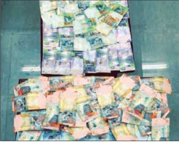
الذنانير التي سلبها وافدان في يوم واحد بلغت 1600 دينار