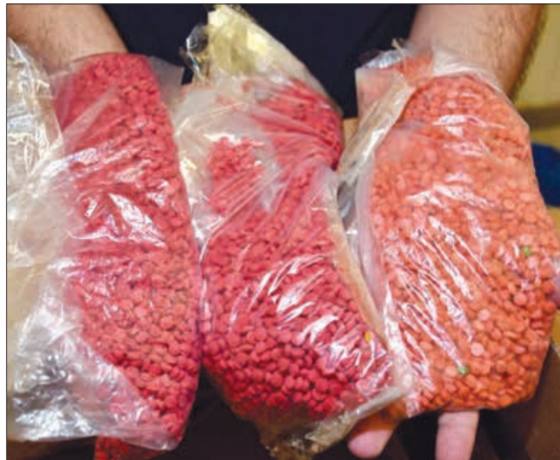
الحبوب المخدرة التي ضبطت مع الأسويي

وذكر نائب رئيس لجنة الإعلام الجمركي مراقب المطار عيسى بن عيسى، إن مقتنسا في مبنى الطيران العام «مطار سعد العبدالله» اشتبه في أمتعة الوافد خلال مرورها على الأجهزة الدقيقة وعليه قام المفتش الجمركي وتحت إشراف رئيس النوبة بإخضاع أمتعته للتفتيش الدقيق، وتبين أنه قام بوضع 3 أكياس حبيبة الواحد نحو 3000 حبة في أفضية صندوقه كرتون تعلموها