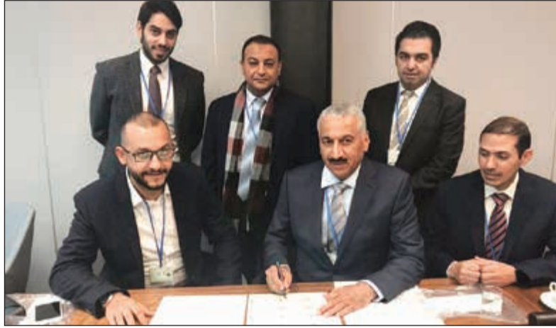
اللواء فهد الشويح يوقع العقد ويبدو العقيد سالم العجمي والقائد خالد العدواني وبشار ماشم

تأكيداً لما انفردت بنشره «الأنباء» عن توجه «الداخلية» لاستخراج رخص السوق إلكترونياً (أون لاين)، وقع وكيل وزارة الداخلية المساعد لشؤون المرور بالإناية اللواء فهد الشويح العقد مع الشركة الخاصة للرخص «السوق الذكية» في بولندا والتي تعمل وفقاً لأحدث المواصفات العالمية والحاصلة على شهادة الأيزو بالتعاون مع برنامج الأمم المتحدة الإنمائي والأمانة العامة للتخطيط والتنمية، وذلك للعمل على تبسيط الخدمات المقدمة للمواطنين والمقيمين في الكويت، وتوفير المال والوقت.