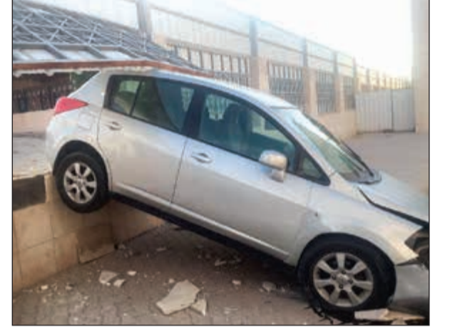
المركبة وقد استقرت داخل المدرسة