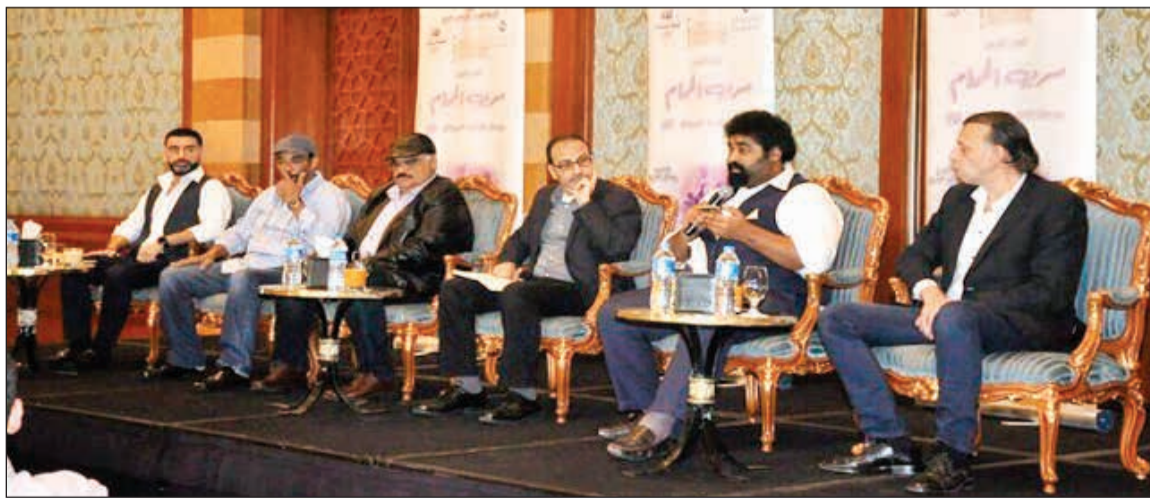
فريق فيلم «سرب الحمام» في المؤتمر الصحفي

175 فيلماً من 53 دولة تعرض في أقسام المهرجان المختلفة منهم 40 فيلماً ستتم ترجمتها إلى اللغة العربية، واختارت إدارة مهرجان القاهرة السينمائي الدولي الفيلم الأمريكي «Mountain Between Us» (الجبل بيننا) لعرضه في حفل الافتتاح، من إخراج الفلسطيني هاني أبوأسعد وبطولة البريطانيين كيت وينسلت وإدريس ألبا. من جانب آخر عقد فريق فيلم «سرب الحمام» مؤتمراً صحافياً بحضور جميع أبطال العمل متمنين تحقيق جائزة للكويت في هذا المهرجان الدولي.