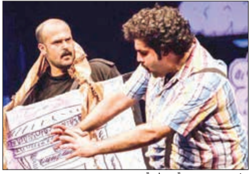
مشهد من مسرحية «عطسة»