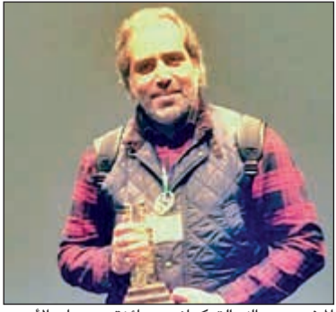
المخرج عبدالله التركماني وجائزة مهرجان الأردن