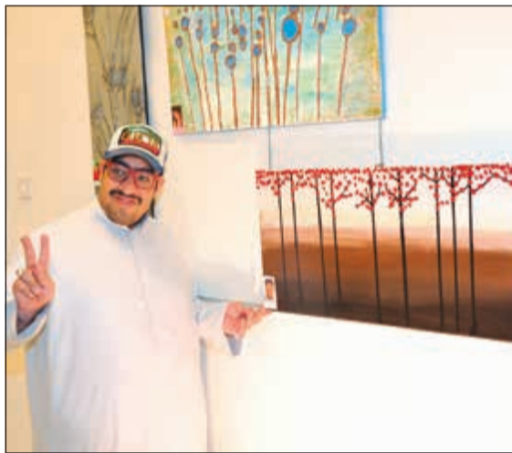
أحد المشاركين أمام أعماله الفنية