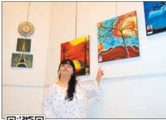
مشاركة تعرض لوحاتها