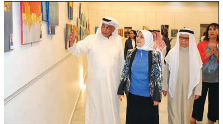
الصبيح خلال جولة تفقدية في المعرض

واشغال اوقات فراغهم بما يعود عليهم بالنفع. وقالت: على الاهالي تشجيع ابناءهم على مواصلة العمل والإبداع، فهناك مواهب مختلفة يجب اكتشافها وصقلها لتحقيق ما نتمناه بالشاركة في المعارض العالمية، لافتة الى ان هناك ابداعات كثيرة برزت خلال المعرض، مما فاجأ المشاركين في حفل الافتتاح بما فيهم اولياء الامور بوصول ابناءهم لهذا المستوى العالي من الفن، معربة عن شكرها لكل من ساهم في نجاح المعرض والانجاز الذي وصل اليه الابناء.