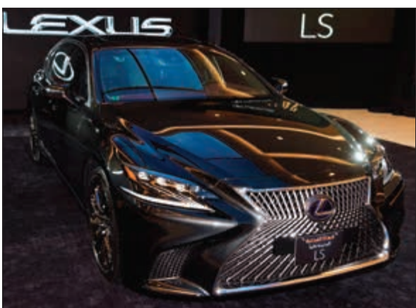
شبكة أممي يمنح المقدمة حضوراً معززاً

حماية شاملة للركاب مع نظام لكزس للسلامة بلاس+ مقصورة فاخرة تمنح الركاب شعوراً غامراً بالحفاوة