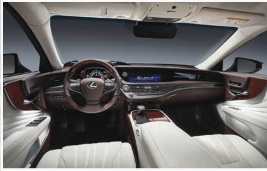
تصميم المقصورة معتم بالفخامة