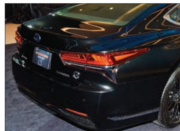
خطوط تصميم جديدة بروح رياضية