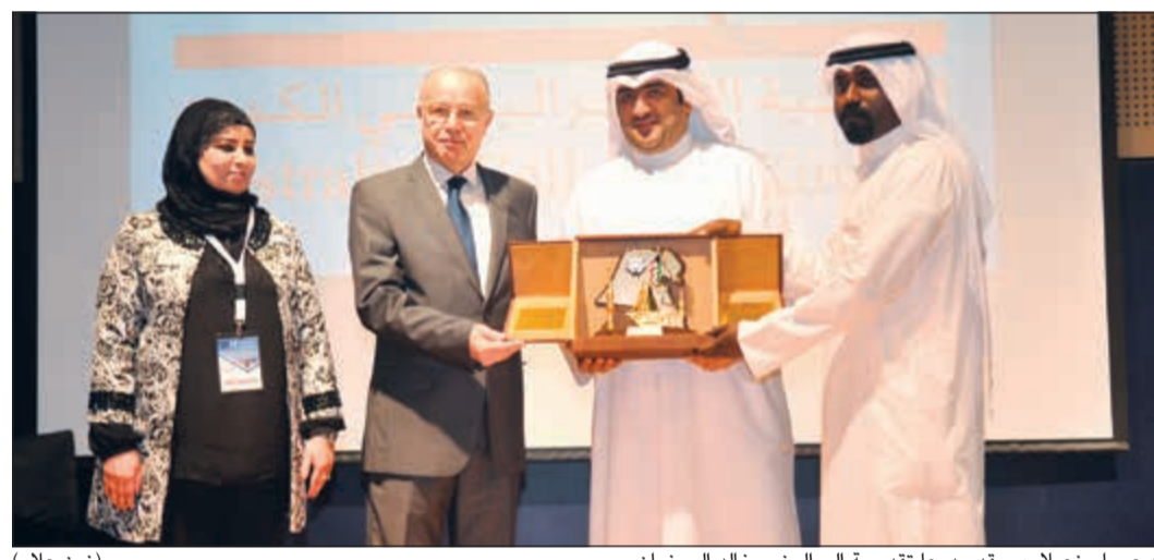
د.عصام زعيلاوي يقدم درعاً تقديرية إلى الوزير خالد الروضان

لمشاهدة الفيديو يمكن استخدام QR كود أو الـ