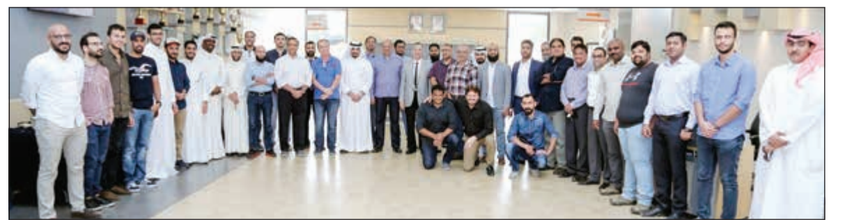
المشاركون في الدورة

بحرص بنك وربة على تطوير مهارات موظفيه وإبقائهم على آخر المستجدات والتطورات العالمية في قطاع الصيرفة عموماً والإسلامية خاصة وذلك لتنمية مهاراتهم وتعزيزها بالثقافة المصرفية، بناء عليه والتزاماً بتوجيهات وتعليمات بنك الكويت المركزي، قام بنك وربة - البنك الأفضل في الخدمات المصرفية لقطاع الشركات والخدمات المصرفية لقطاع الاستثمار في الكويت - بتنظيم دورة تدريبية لموظفيه بعنوان «مكافحة غسيل الأموال وتمويل الإرهاب»، ساهمت في تبصيرهم حول هذا المفهوم، ألياته، والمخاطر الناجمة عنه. وقد عقدت الدورة في 18