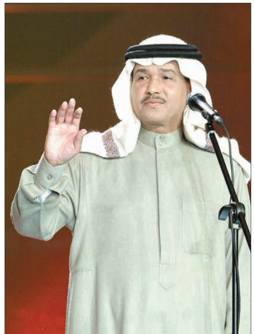
«فنان العرب» محمد عبده

تعلقا على فيديو غنائه مع ابنه الوليد، وما إذا كان الوليد سيدخل مجال الغناء كما فعلت شقيقته ماريتا، قال النجم اللبناني عاصي الحلاني: «الفيديو كان بمنزلة مزحة، ولم يكن مقصودا أن يغني فيه. ثم انتشر الفيديو بشكل كبير، أو من بان الأمور العفوية والبسيطة تنتشر بسرعة بين الناس ويتفاعلون معها». وحول احتراف ابنه الغناء، كشف عاصي أن الفكرة واردة بالطبع، وهو يدرس الموسيقى ولكن المشروع مؤجل إلى حين دخوله الجامعة، وهو مستمتع جيد ويغني بطريقة جميلة جدا، ويحب أغنيات العلامقين وديع الصافي وملحم