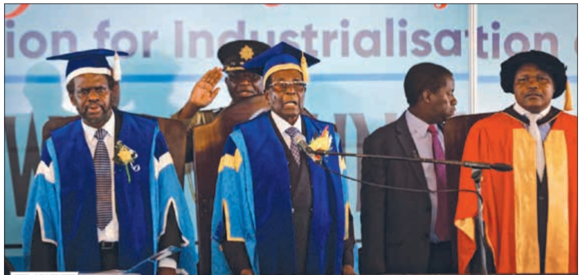
الرئيس موغابي خلال افتتاحه مراسم حفل تخريج طلاب جامعيين في العاصمة هراري امس

لمشاهدة الفيديو يمكن استخدام QR كود أو الـ