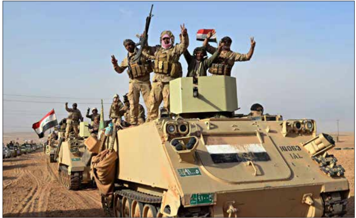
عناصر من القوات العراقية يرفعون العلم الوطني عقب تحريرهم قضاء راوة من «داعش» امس

لكمال السيطرة على الحدود الدولية وتطهيرها بين العراق وسورية».