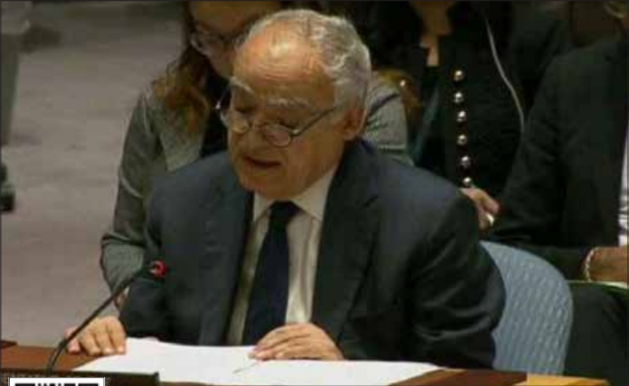
المبعوث الأممي إلى ليبيا غسان سلامة خلال إفادته أمام مجلس الأمن امس الاول

لمشاهدة الفيديو يمكن استخدام QR كود أو الـ