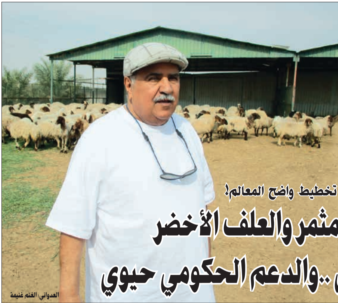
العدواني: الفقم غنيمه