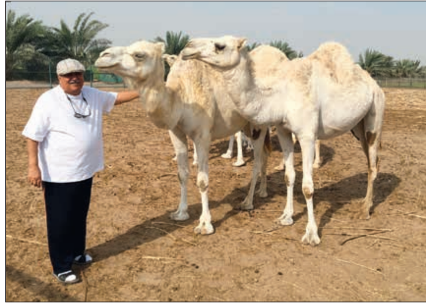
تربية الإبل هواية في الكويت

مكانة النخيل المثمر وأنجي (أبو ماجد) باللائمة على الجهات والمراكز العلمية في الكويت