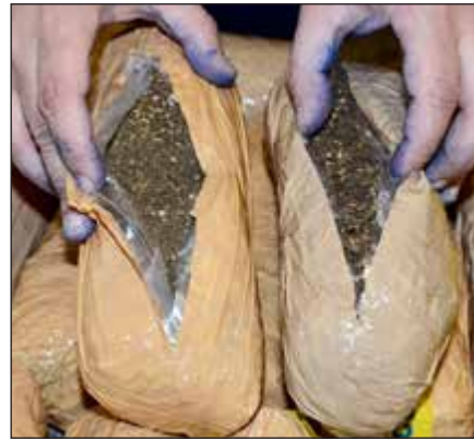
فتح الغالفات كشف المستور

سيظلون السد المنع حيال جميع عمليات التهريب. وتحذر الإدارة العامة للجمارك جميع القادمين عبر المنافذ المختلفة من مغية تهريب المنوعات بكل أشكالها. وتؤكد أنها ستظل سدا منيعا حيال كل من تسول له نفسه تهريب أي من المواد المنوعة بكل أنواعها.