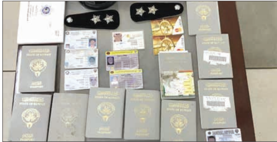
المضبوطات تنوعت ما بين جوازات ورخص سوق وهويات ورتب عسكرية