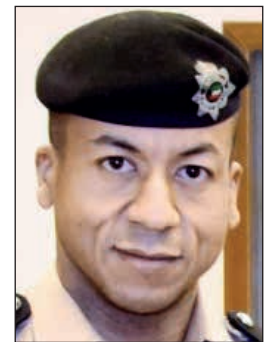
المقدم يوسف مرشد

القاهرة - ناهد إمام قال مساعد مدير إدارة العلاقات العامة بالإدارة العامة للعلاقات والإعلام الأمني بوزارة الداخلية المقدم يوسف مرشد أن استخدام التكنولوجيا بطريقة سلبية خاصة من جانب قاندي المركبة لعب دورا في تزايد الحوادث المرورية أذ ارتفعت معدلات حوادث السيارات المرورية أكثر من 60% خلال السنة الماضية ونصف العام الحالي. وأشار المقدم المرشد على هامش مشاركته في فعاليات الأسبوع الكويتي العاشر في مصر إلى أن المخدرات الرقمية تؤثر على الرأس حينما يسلمها أحد يتشنج وفي البداية تقدم