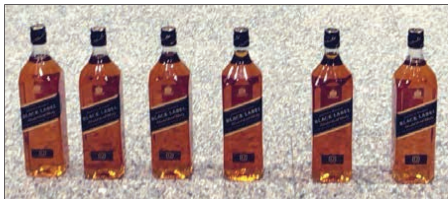
.. والخمر المضبوطة في الأحمدي

عبدالله سفاح بإحالة وافد هندي يدعى (ع. أ. ك) كبير) إلى مكافحة المخدرات بعد أن ضبط من قبل إحدى دوريات أمن الأحمدي في منطقة المنقف داخل ساحة تريبية. ولدى طلب إنباتته تبين حيازته كيسا أسود، وبيفتح الكيس وجد بداخله 6 زجاجات خمر مستوردة.