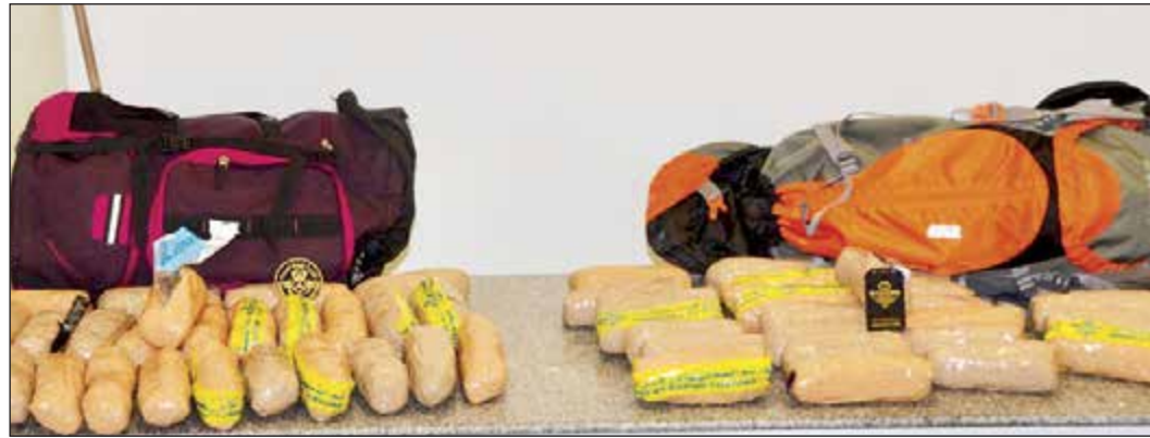
المخدرات جلبت على متن طائرة واحدة وفي أمتعة وافدين هنديين