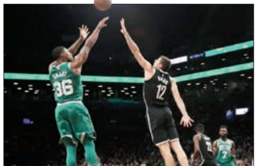
المقنع ايرفينغ بيدع مع بوسطن

قاد كايري ايرفينغ فريقه بوسطن سلتيكس إلى الفوز الثالث عشر تواليًا اثر تغلبه على بروكلين نتس 109-102 ضمن دوري كرة السلة الأمريكي للمحترفين بتسجيله 25 نقطة. وهي أطول سلسلة انتصارات لسلتيكس في الدوري منذ أن حقق 14 فوزا تواليًا بين نوفمبر وديسمبر عام 2010، لكن الرقم القياسي له هو 19 فوزا وحققه بين نوفمبر وديسمبر عام 2008. ويات سلتيكس بالتالي يملك أفضل سجل هذا الموسم في الدوري برصيد 13 فوزا وخسارتين تعرض لهما في مقلته، وكانت آخر خسارة لبيوسطن عندما سقط على أرضه أمام ميلووكي جازز في 18 أكتوبر الماضي في اليوم التالي لخسارته جهود نجمه غوردون هاورد لصابته في ركبته خلال خسارته أيضا أمام كليفلاند.