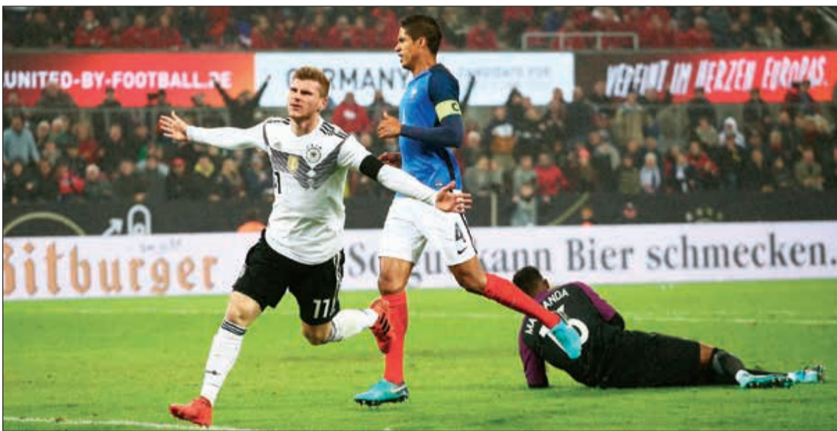
فرحة موهبة المشانفت فيرنر بهدف التعادل (أب)

لكن نيجيريا، قلبت الطاولة على أبطال مونديال 1978 و1986، إذ قلصت الفارق عن طريق ايهياناتشو (45). وفي الثاني، ضرب ايووبي (52)، ثم تقدموا عبر البديل براين ايدوو (54). وفي الدقيقة 73، سجل لفريق المدرب الألماني غرنوت رور ايووبي هدفه الثاني والرابع للفريق الأخضر (73).