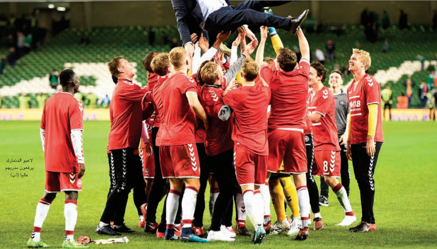
لاعب الدنمارك يرفعون مدربهم عليا