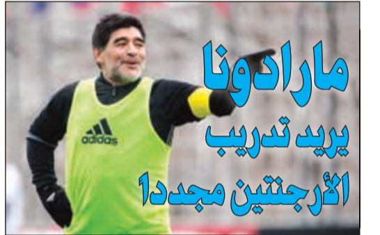
مارادونا يريد تدريب أترجنتين مجددا

كشف تقرير إخباري أمس أن الاتحاد الأمريكي لكرة القدم يدرس إمكانية استضافة مباريات في العام المقبل لمنتخبات أخفقت في التأهل لنهائيات كأس العالم 2018 بروسيا، ومنها منتخبات إيطاليا وهولندا وتشيلي وغانا وأميركا. وأوضح شبكة «إي.إس.بي.إن» أن الاتحاد الأمريكي كشف أنه يبحث الأمر بالتعاون مع مسؤولي التسويق لدوري النخبة الأمريكي لكرة القدم (إم.إل.إس). ولم يتضح بعد ما إذا كان المقترح الخاص بالمباريات، التي تقام قبل كأس العالم المقرر بين 14 يونيو و15 يوليو 2018، يتمثل في تسليمة من المباريات الودية تشارك فيها أيضا منتخبات من الأمريكيتين استعدادا للمونديال أم أنه يتمثل في إقامة بطولة مصغرة.