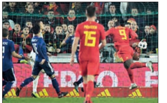
هدف لوكاكو بمرمي اليابان

أصبح المهاجم روميلو لوكاكو أفضل هداف في تاريخ منتخب بلجيكا بعد تسجيله هدف الفوز لبلاده أمام اليابان في مباراة دولية ودية. ورفع لوكاكو (24 عاما) مهاجم مان يونتايند رصيده إلى 31 هدفا مع الشياطين الحمر للقارة العجوز، ليتخطى بول فان هيمست وبرنارد فور هوف (30 هدفا). وسجل لوكاكو هدفة في الدقيقة 72، وذلك بعد توقيعه هدفين لبلجيكا التي ستشارك في مونديال 2018، في مرمى المكسيك (3-3) الجمعة الماضي.