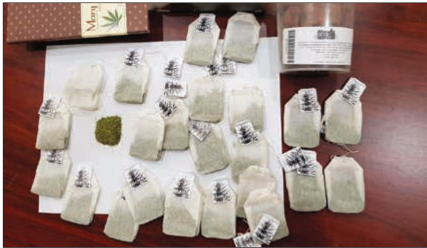
الماريغوانا مخبأة في أكياس شاي