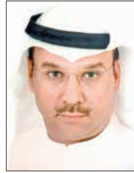
اللواء محمد الشرحان

بشأن القضايا التي ارتكباها وكيفية تنفيذها. وبحسب مصدر أمني فإن تعدد قضايا سرقات سلندرات الغاز في الأحياء والحدائق المنزلية استدعى من مدير مباحث مبارك الكبير تشكيل فريق عمل لإغلاق ملفات القضايا المسجلة ضد مجهول. وأضاف المصدر: بعد تحريات امتدت لأكثر من أسبوع توصل رجال المباحث إلى هوية المتهمين وتبين أن الأول عراقي يدعى (ل.م.س)، من مواليد 1982 والثاني من غير محدد الجنسية ويدعى (ط.س) من مواليد 1981، وعليه تم استصدار