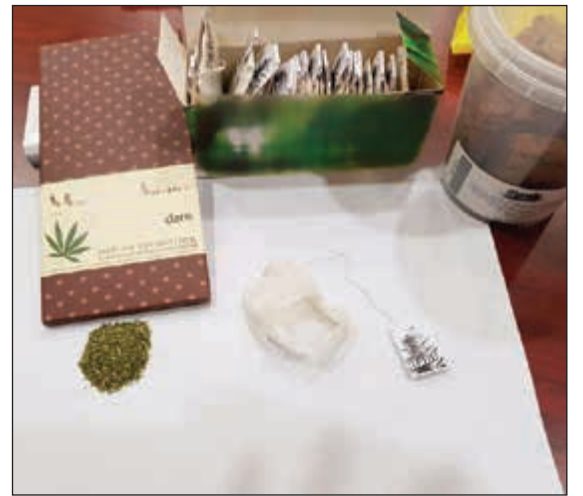
المضبوطات التي عثر عليها في أمثلة الكندي

أمتمته للتفتيش، وعثر على كمية من مخدر «الماريغوانا» بداخلها ومخبأة في عبوات للشاي الأخضر، كما ضبط بحوزته أيضا على أكثر من 500 حبة مخدرة.