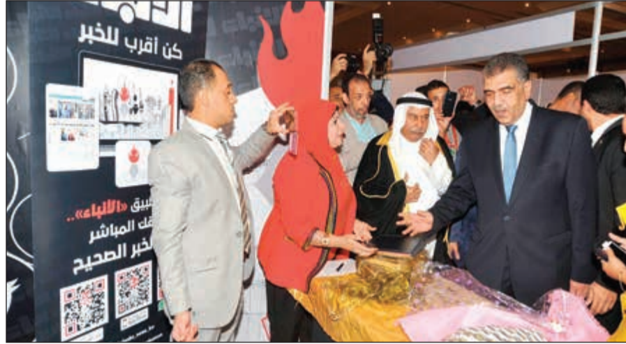
.. ويقومون بزيارة جناح «الأنباء» خلال المعرض (ناصر عبدالسيد)