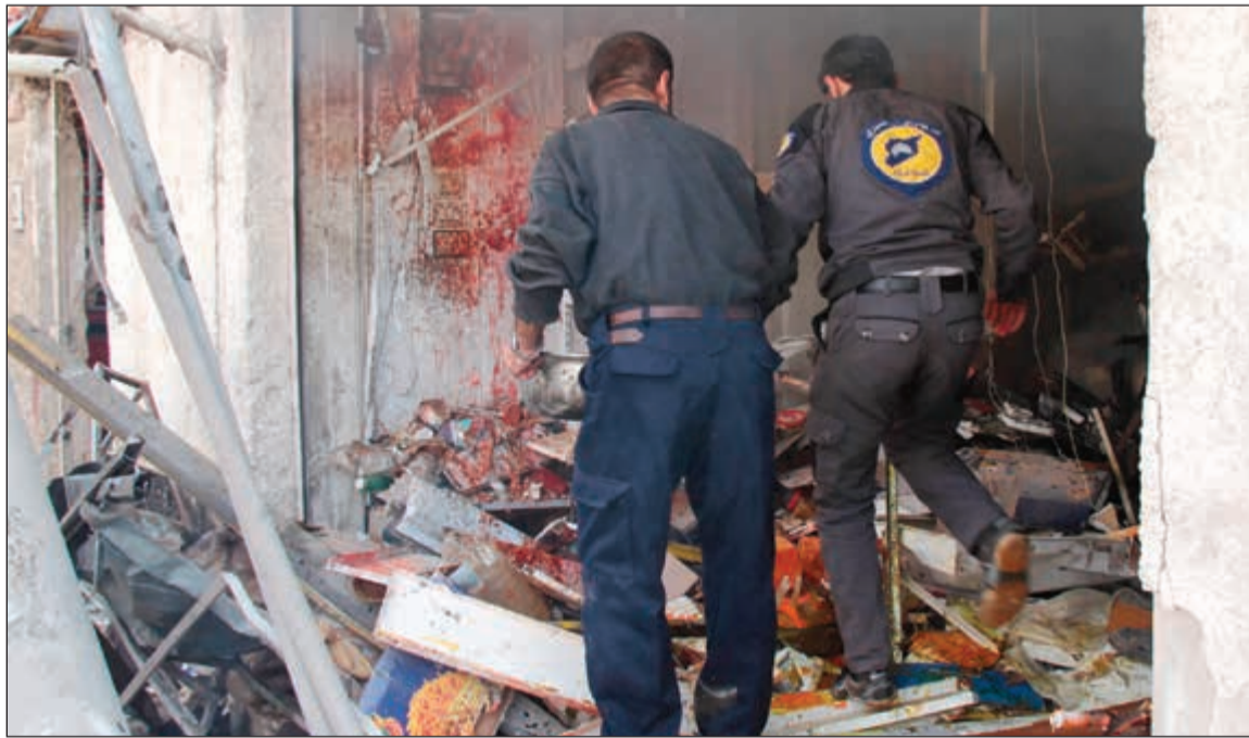
عصران من الحوذ البيضاء يبحثان عن ضحايا في حمام خلفته غارة على دوما في الغوطة المحاصرة