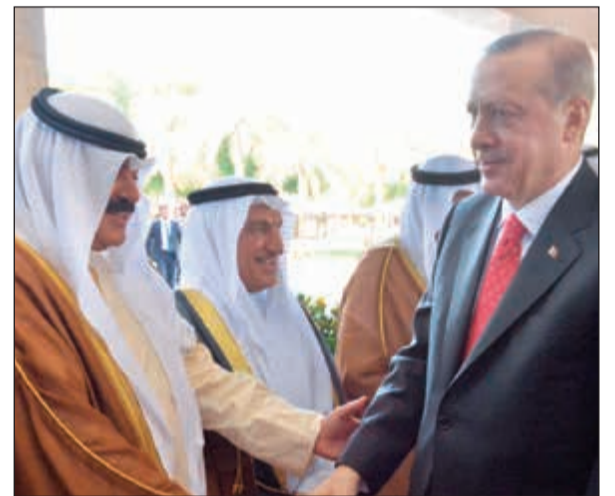
خالد الجارالله مصافحا الرئيس التركي

مع صاحب السمو الأمير الشيخ صباح الأحمد. وكان على رأس مودعيه على أرض المطار صاحب السمو الأمير الشيخ صباح الأحمد ورئيس مجلس الأمة مرزوق الغانم وسمو الشيخ جابر المبارك رئيس مجلس الوزراء والنائب الأول لرئيس مجلس الوزراء ووزير الخارجية الشيخ صباح الخالد ونائب رئيس مجلس الوزراء ووزير الدفاع الشيخ محمد خالد والأميري وزير شؤون الديوان الأميري الشيخ علي الجراح ووزير الدولة لشؤون مجلس الوزراء ووزير الإعلام بالوكالة الشيخ محمد عبداللله وكبار القادة بالجيش العربية والاعتبار مضائق السيفر والإدارة العامة للإطفاء.