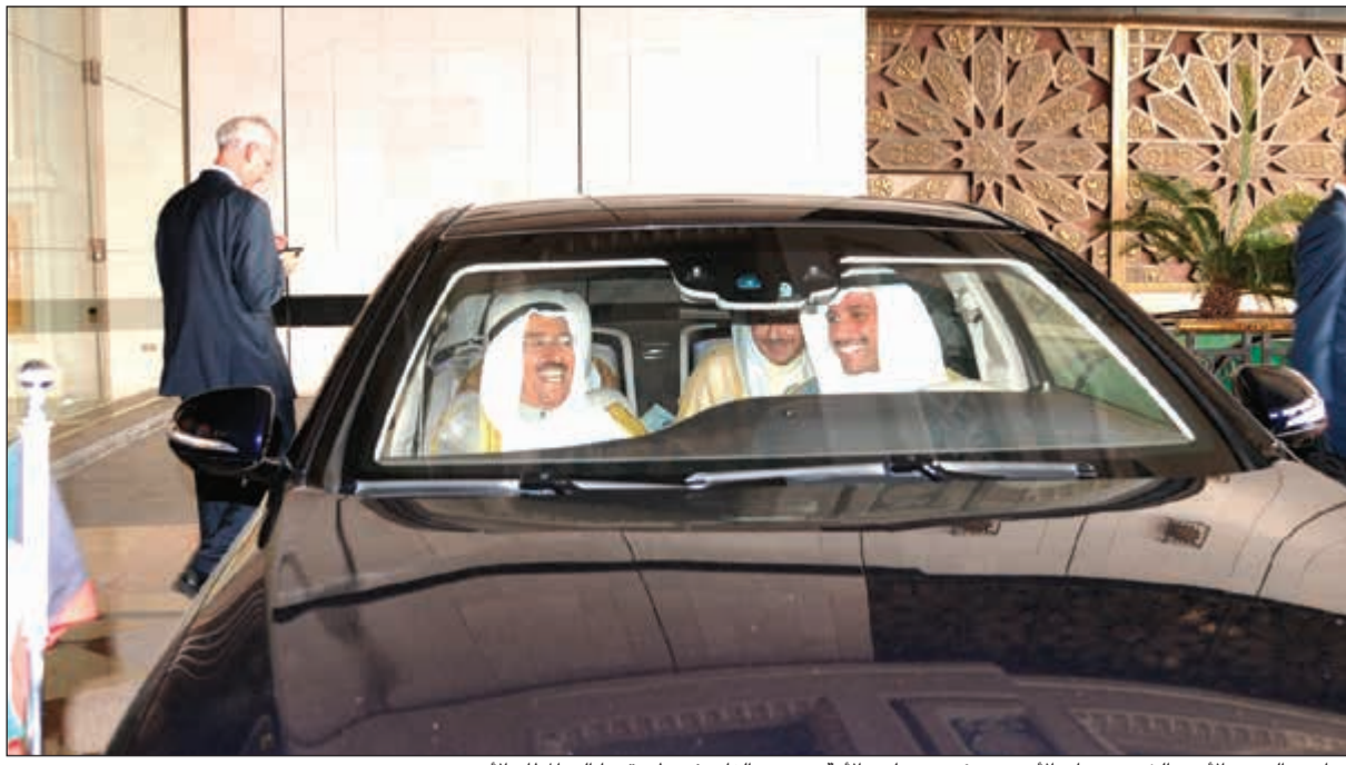
صاحب السمو الأمير الشيخ صباح الأحمد ورئيس مجلس الأمة مرزوق الغانم في طريقهما إلى المطار الأميري