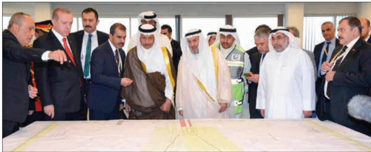
الرئيس التركي وسمو الشيخ جابر المبارك وم. عبدالرحمن المطوع يطلعون على مخطط لمشروع مبنى الركاب الجديد