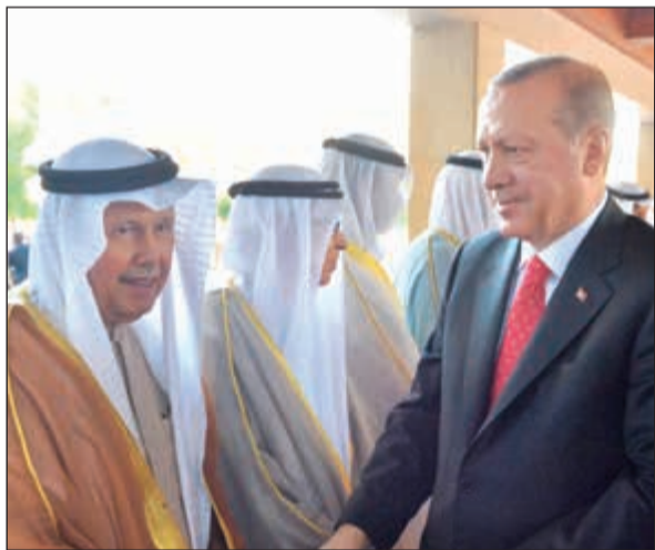
السفير أحمد فهد القهيد مصافحا الرئيس التركي