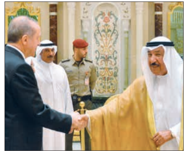
الشيخ جابر الجبيل الله مصافحا الرئيس رجب طيب أردوغان