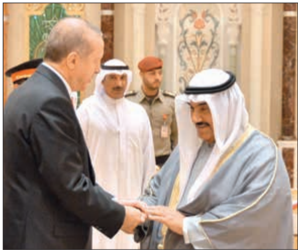
سمو الشيخ ناصر المحمد مصافحا الرئيس التركي