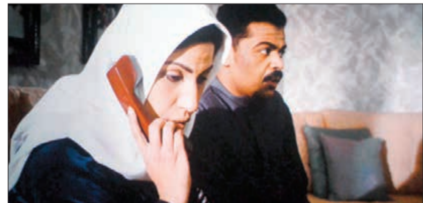
مشهد من فيلم «أوفيه»

وجوده عالية. وبسؤاله: لماذا قل نشاط الإنتاج المشترك لدول مجلس التعاون الخليجي؟ أفاد بأن المؤسسات التابعة أنتجت برامج مميزة بالمسابق لكنها تموت موتاً بطيئاً، وقال: الدول لم تعد تتسدد حصصها للمؤسسة وبالتالي لم تعد قادرة على الإنتاج، وآخر مرة أنتجوا 6 أفلام وثائقية فيلم عن كل دولة، وكان فيلماً عن السعودية، وحصلنا على الجائزة الفضية بمهرجان القاهرة، ولكن توقف الإنتاج بعدها، ويفترض من وزارة الإعلام أن تتبنى تاريخ الكويت الحضاري ودورها في العمل الإنساني من خلال أفلام وثائقية أو درامية، فالاهتمام بدور الكويت الإنساني لم يتم توثيقه بعد بالشكل المطلوب. واختتم الغريب حديثه بتوجيه الشكر للجزيرة «الأنباء» باعتبارها من أصدق الصحف الكويتية، وقدم الشكر لكل العاملين فيها.