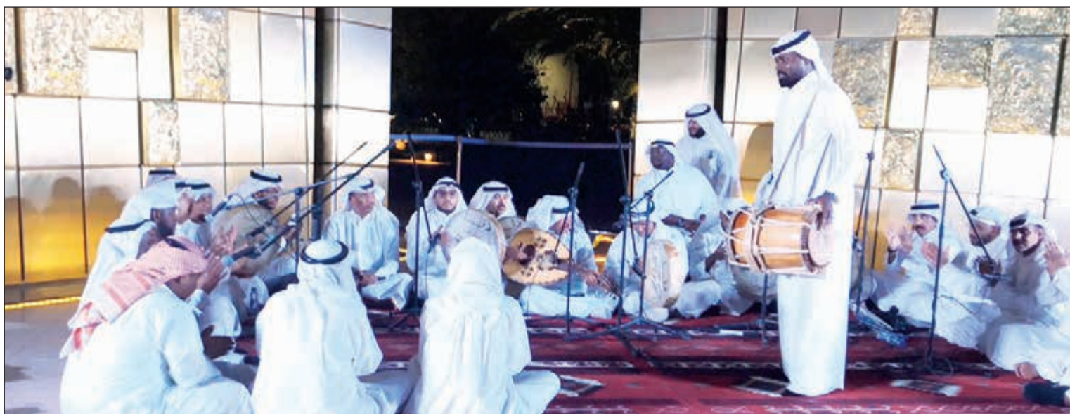
فرقة بن حسين تدع أمام نصب الدستور الكويتي