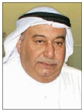
السفير محمد الذويخ