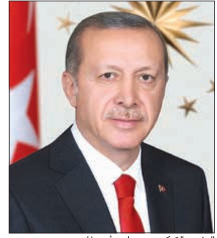
الرئيس التركي رجب طيب أردوغان