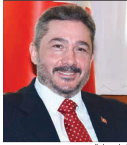
السفير مراد تامير

ذكر السفير التركي لدى البلاد مراد تامير أن الرئيس أردوغان سيصل إلى الكويت في ساعة متأخرة من مساء اليوم الإثنين، على أن تبدأ الزيارة الرسمية غداً الثلاثاء، مضيفاً أن الوفد المصاحب للرئيس التركي يتكون من 10 وزراء، فضلاً عن عدد من النواب في البرلمان التركي. وكشف تامير، في تصريحات خاصة لـ «الأنباء»، أن الزيارة ستشهد توقيع ثلاث اتفاقيات جديدة بين البلدين ليصبح إجمالي الاتفاقيات التي تيسر العلاقات الثنائية بينهما 54 اتفاقية، موضحاً أن أبرز هذه الاتفاقيات تتعلق بدعم وحماية الاستثمارات بين