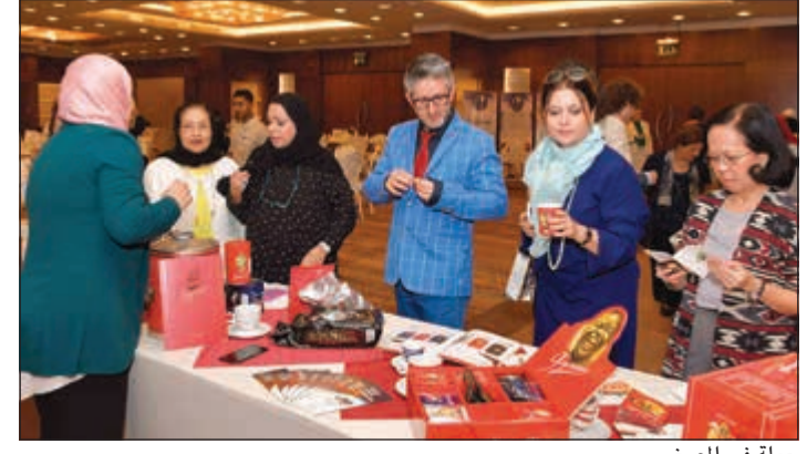
جولة في المعرض

لمشاهدة الفيديو يمكن استخدام QR كود أو الـ