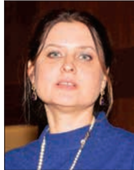
زوجة السفير الروسي