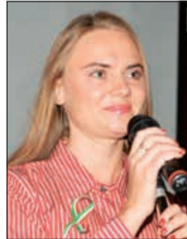
زوجة نائب رئيس البعثة الإيطالية