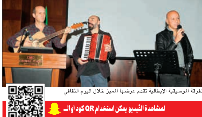
الفرقة الموسيقية الإيطالية تقدم عرضها المميز خلال اليوم الثقافي

وقال كورتينييري خلال كلمته إنه بالتعاون مع المجلس الثقافي الوطني للثقافة والفنون والآداب سيقيم الأسبوع الثقافي الإيطالي في الكويت، وسيشتمل حفلة