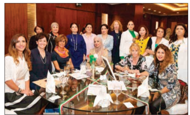
مجموعة من الشخصيات المشاركة في الحفل