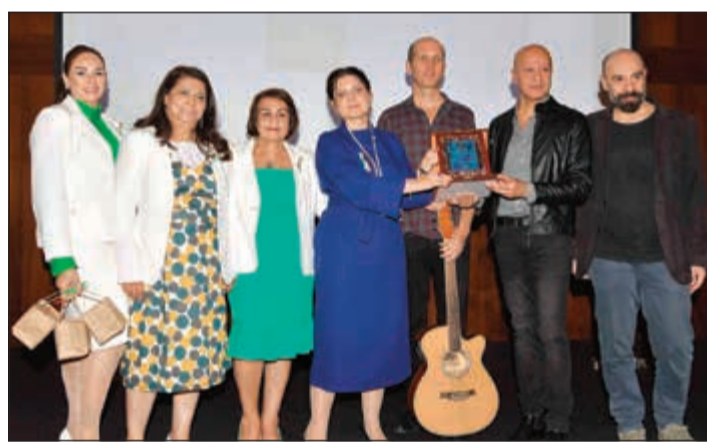
تكرم أعضاء الفرقة الموسيقية