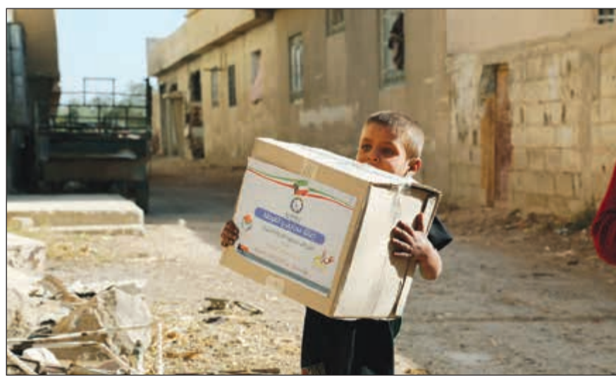
شكرا أهل الخير

منتجة وتحولت من العوز إلى العطاء والإنتاج. واختتمت تصريحه بشكر أهل الخير داعمي جمعية النجاة الخيرية وكافة الجمعيات الخيرية الكويتية فالجميع يتنافس في خدمة المستفيدين آملين من العلي القدير أن يعود اللاجئون والنازحون إلى ديارهم سالمين غانمين. للتواصل ودعم المشروع الاتصال على 1800082.