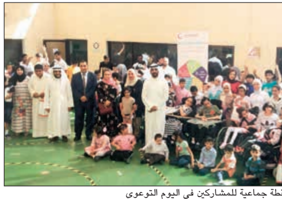
لقطة جماعية للمشاركين في اليوم التوعوي

أقامت إدارة التنمية الاجتماعية التابعة لجمعية صندوق إعانة المرضى يومها التوعوي الصحي في الجمعية الكويتية لرعاية المعاقين بمركز الرعاية النهارية بمحافظة الجبراء وذلك بالتعاون والشراكة المجتمعية مع إدارة تعزيز الصحة العامة بوزارة الصحة. وقد تخلل اليوم التوعوي فلاح توعوي عن التغذية السليمة وفلاح توعوي عن الإسعافات الأولية وذلك لفئات المعاقين منتسبي المركز والطاقم الوظيفي العامل. وقد قامت إدارة التنمية الاجتماعية بتوزيع جوائز وهدايا رمزية على جميع الطلبة والطالبات الذين يقدر عددهم بنحو 80 طالبا وطالبة من مختلف الفئات العمرية خلال الحفل الترفيهي الذي أقامه المركز.