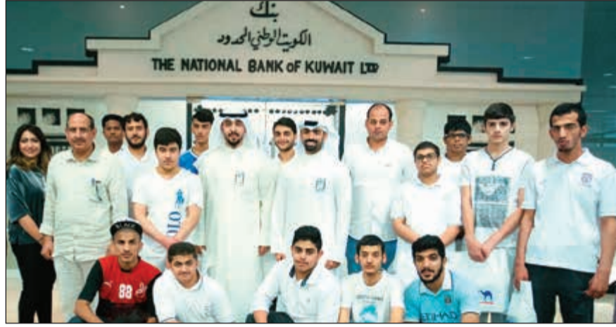
مسؤولون من إدارة العلاقات العامة في البنك مع طلبة مدرسة الأمل المشتركة

من خلال الخدمات الجديدة التي يقدمها لهذه الشريحة الحيوية من العملاء، ولكن أيضا من خلال العديد من الفرص التدريبية التي يوفرها لهم مثل التدريب الميداني وبرنامج التدريب الصيفي.