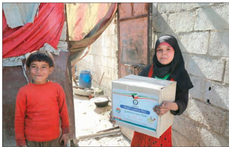
رسم الإيسامة على وجوه المستفيدين غايتنا