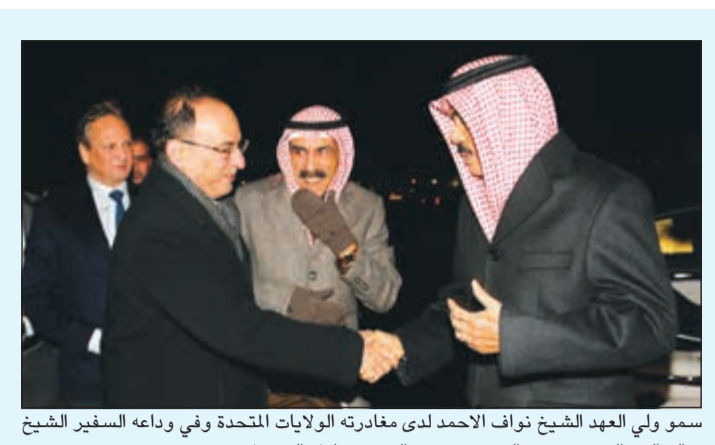
سمو ولي العهد الشيخ نواف الأحمد لدى مغادرته الولايات المتحدة وفي وداعه السفير الشيخ سالم عبدالله ومنصور العتيبي وبيدو الشيخ مبارك الفيصل