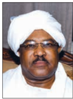
السفير السوداني محيي الدين سالم

استضافة دياب كشف السفير السوداني محيي الدين سالم أن الرئيس السوداني عمر البشير كان قد قدم دعوة لصاحب السمو الأمير الشيخ صباح الأحمد لزيارة السودان، مغربا عن أمهه في أن تتم الزيارة خلال الفترة المقبلة. وحول سبب تأخر إعلان السودان كشريك استراتيجي في المجموعة الخليجية قال سالم - في تصريحات للصحافيين على هامش المؤتمر الصحفي الذي عقده بمناسبة المنقلى الاقتصادي السوداني - الكويتي - أن ما يحدث في منطقة الخليج من تطورات هو بحد ذاته إيجابية ويعتبر سببا كافيا دون الدخول في التفاصيل. ولفت سالم إلى أن السودان قد تجاوز عقق الزجاجة بالنسبة لعوامل الأمن والاستقرار بشهادة المراقبين ولعل أبرز الدلالات القرارات الأممية التي اتخذت فيما يتعلق بالبعثة الأممية التي أتت