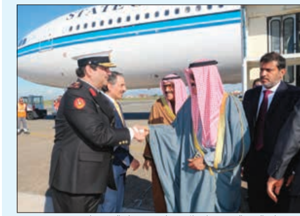
سمو ولي العهد الشيخ نواف الأحمد لدى وصوله إلى روما

بحفظ الله ورعايته وصل سمو ولي العهد الشيخ نواف الأحمد امس إلى العاصمة الإيطالية روما في زيارة خاصة. وقد كان في استقبال سموه على أرض المطار سفيرنا لدى جمهورية إيطاليا الشيخ علي الخالد وقنصلنا العام في ميلانو وشمال إيطاليا عبدالناصر بوخضور وأعضاء السفارة. هذا وقد غادر سمو ولي العهد الشيخ